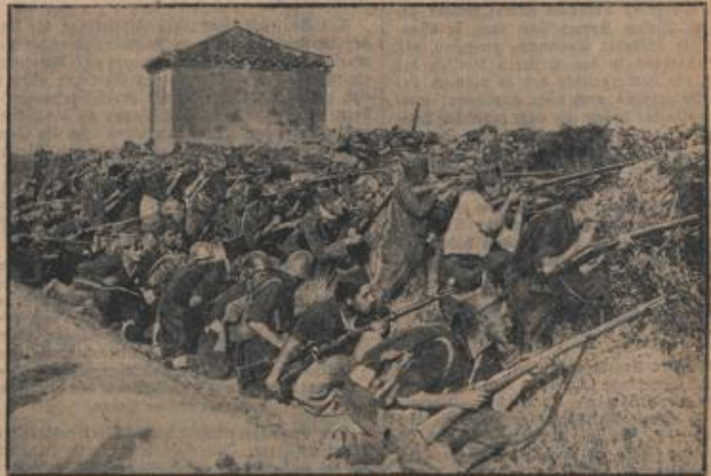
In den blutigen Kämpfen des spanischen Bürgerkriegs ist es in der Sierra de Guadarrama in der Nähe von Madrid gekommen, wo die Marzisten mehrere wertvolle Sturmwaffen auf die Stellungen der nationalen Truppen unterwarfen.

tätigkeit als eine markante Persönlichkeit bezeichnet, heute zugeben müßten, daß er „der unheimlichste Bodsjäger und gefährlichste Aufwiegler der Welt“ sei.