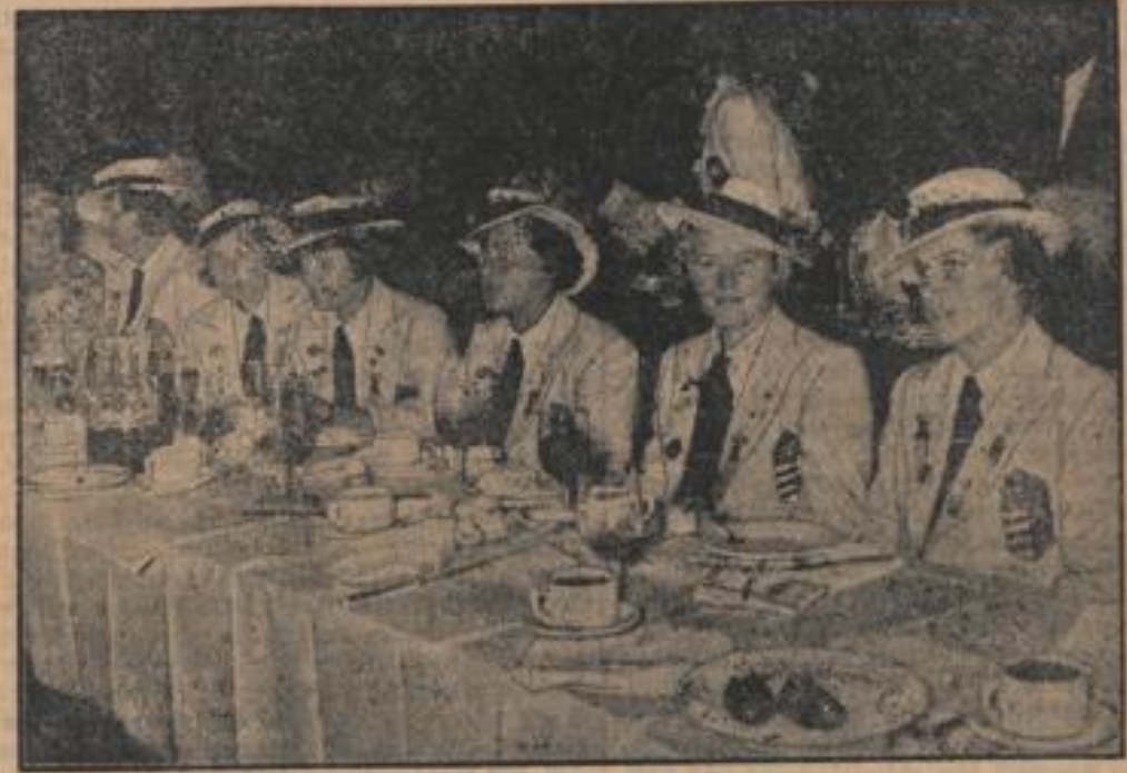
Der früheste Ausklang des letzten Tages

Zum Ausklang der 11. Olympischen Spiele wurden die vielen tausend Teilnehmer in die Deutschlandhalle geladen. Man sieht hier eine Gruppe von unparteiischen Olympiateilnehmerinnen.