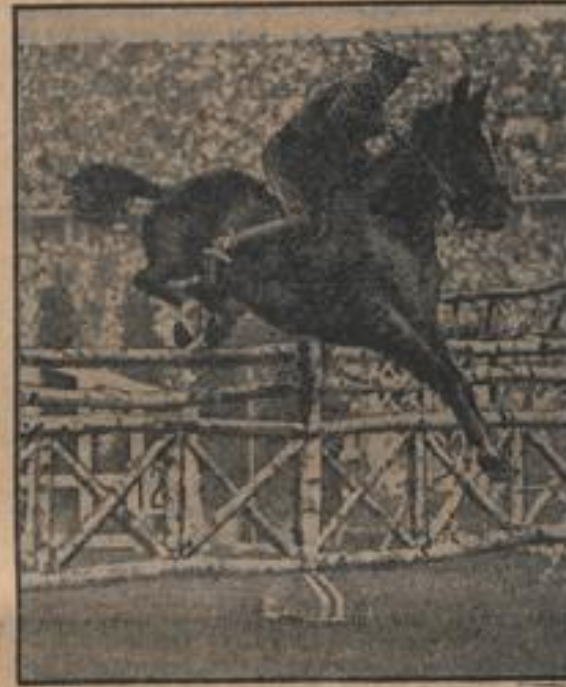
Der zweitbeste Reiter im Jagdspringen

Zum Ausklang der 11. Olympischen Spiele wurden die vielen tausend Teilnehmer in die Deutschlandhalle geladen. Man sieht hier eine Gruppe von unparteiischen Olympiateilnehmerinnen.