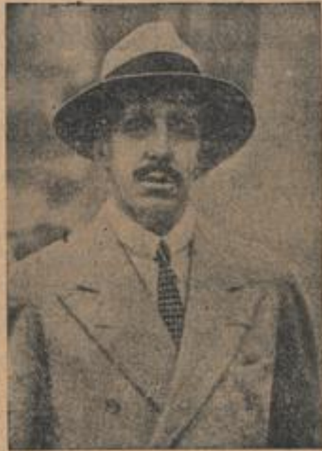
Der 34jährige König Alfons feierte seinen Geburtstag als entthronter Herr.