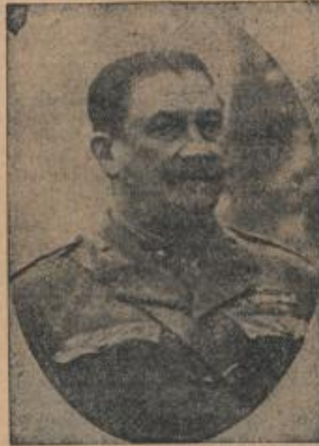
Nach General Berenguer konnte als Nachfolger Primo de Rivera die Monarchie nicht mehr retten.