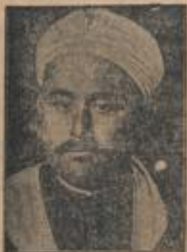
Abd el Krim brachte den Marokko-Aufstand zum Scheitern.