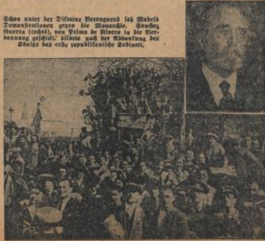
Schon unter der Diktatur Berenguers sah Madrid Demonstrationen gegen die Monarchie. Sanchez Guerra (rechts), von Primo de Rivera in die Regierung geholt, bildete nach der Abdankung des Königs das erste republikanische Kabinett.

Wieder traten die Karlisten mit ihren Ansprüchen hervor. Sie entsetzten einen Militäraufstand und riefen Don Carlos als Karl VII. zum König aus. Aber die Cortes von 1809 erließen eine freirechtliche Verfassung, befielen die Monarchie bei und setzten bis zur Lösung der Thronfolgerfrage einen Regenten ein. Wer sollte König werden? Die Umstürzer unter den Prinzen der Länder blieben ohne Erfolg. Der Ministerpräsident wurde ermordet; der Herzog von Koha, der als König Amadeus I. den Thron bestieg, vermochte dem Lande nicht den Frieden zu geben. Erbitterte Kämpfe wurden zwischen den Monarchisten geführt, und gleichzeitig wühlte im Süden die Anarchie. Im Jahre 1873 sammelten sich in den baskischen Provinzen die Anhänger von Don Carlos, um aus Madrid zu marschieren. Da brach in Cadix der Aufruhr aus.