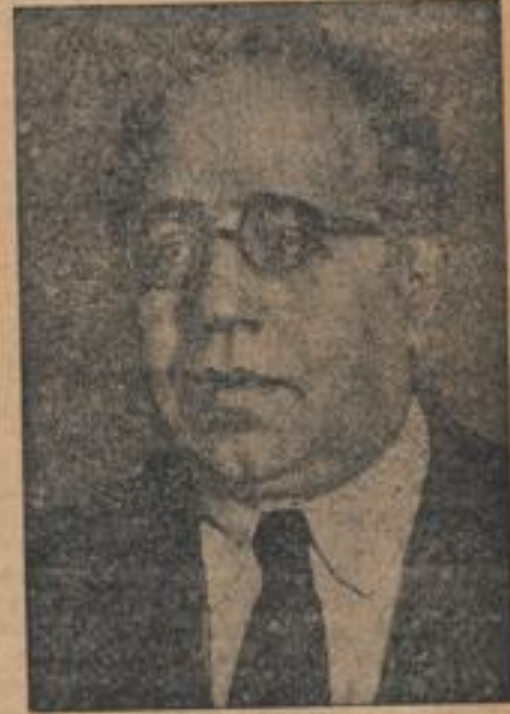
Der heutige Staatspräsident Azana leitete 1931 den republikanischen Aufstand an und war später Ministerpräsident.