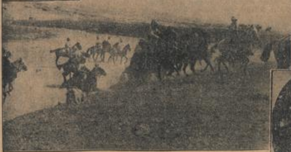
Seit 1909 führt Spanien in Marokko einen verlustreichen Kampf, der durch den Weltkrieg nur kurz unterbrochen wurde. Primo de Rivera (rechts) konnte den Krieg glücklich zum Abschluß bringen.