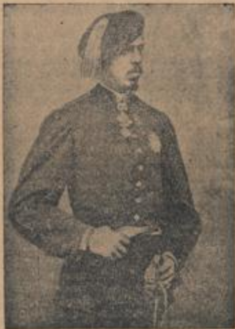
Don Carlos, dessen Ansprüche auf den Thron das Land jahrelang in schwere Unruhen führte.