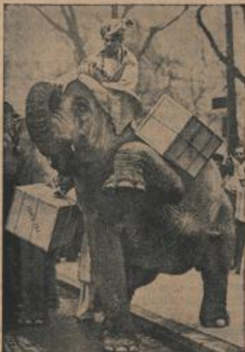
Siel Kraft für kleine Päckchen Den ungewohnten Anblick dieser Tee tragenden Elefanten in den Straßen von London hatte man in der englischen Hauptstadt, wo man mit einer Auktion durch den Lord Mayor den hundertsten Jahrestag der ersten Teekolonisation indischer Tee in London feiert.