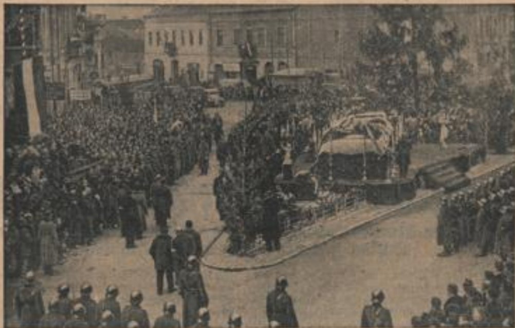
Beisetzung der bei dem unzufälligen Grenzzwischenfall gefallenen Ungarn Unser Bild zeigt eine Hebersicht auf die Trauerfeierlichkeiten in Munkacs.