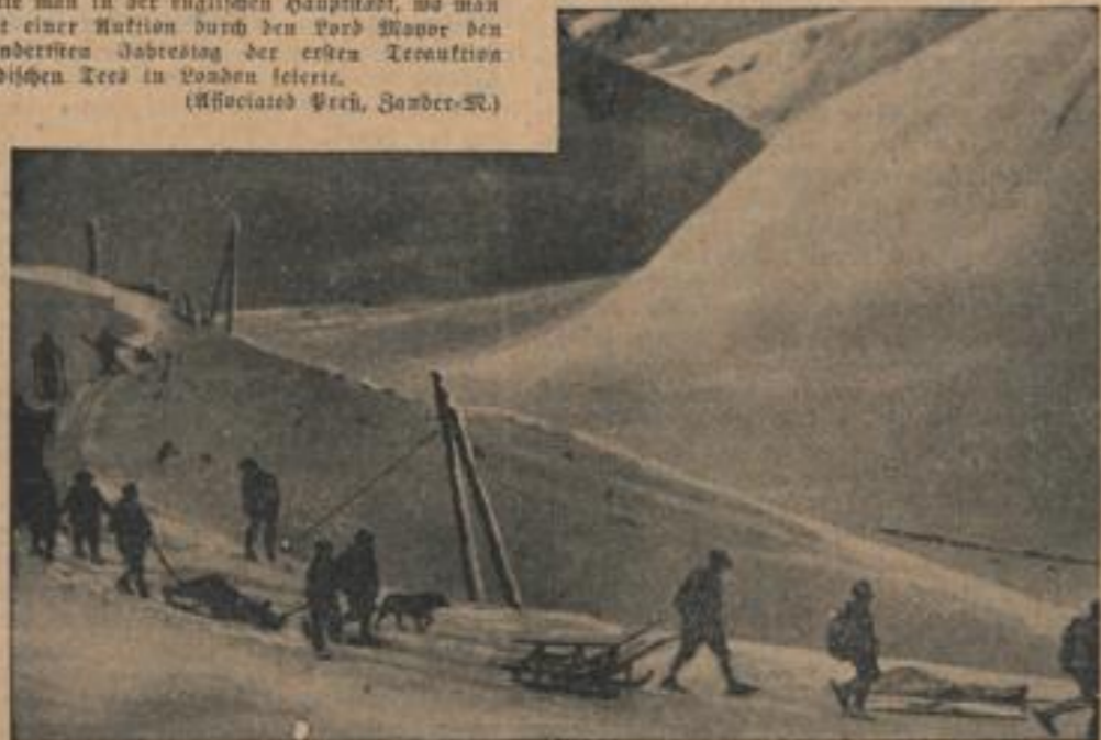
Sie wurden Opfer der Berge Am Golabier in den französischen Alpen wurden sechs Winterportier von einer Lawine getötet. Unser Bild zeigt die Bergung der Opfer des Lawineneingangs durch Alpenkrieger.