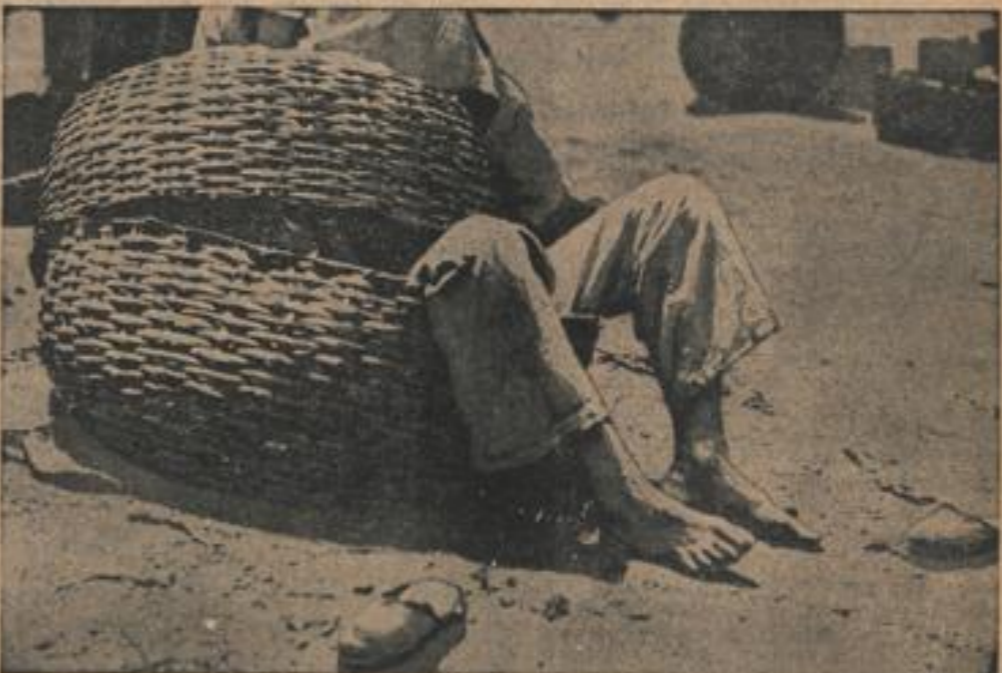
Ein Schnappschuß vom Amazonas Ein brasilianischer Lederhändler am Amazonas hat seine Ware ausverkauft und grübelt nun, in seinem leeren Korb liegend, den Schatten während eines Mittagschlafens. (Zitner, Jander-M.)