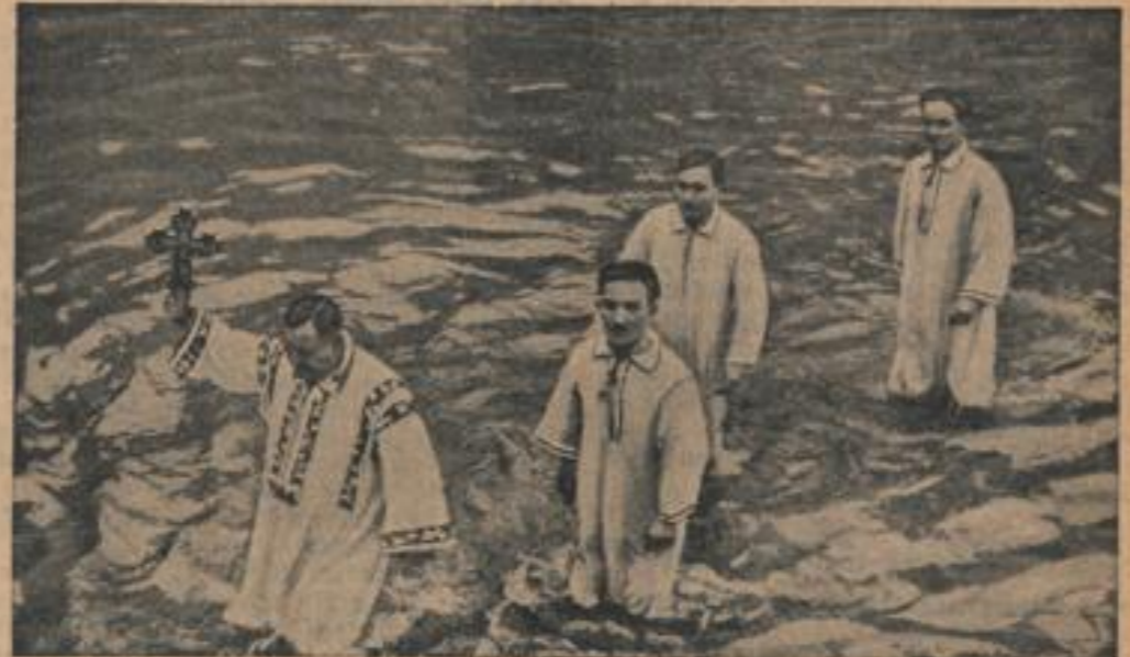
Die traditionelle Wasserweihe in Rumänien Wie alljährlich, fand auch diesmal im Hofarech die Wasserweihe in Anwesenheit des Königs und der gesamten rumänischen Regierung statt. — Bauern bringen das Wasser zurück, das der König in das Wasser geworfen hat.