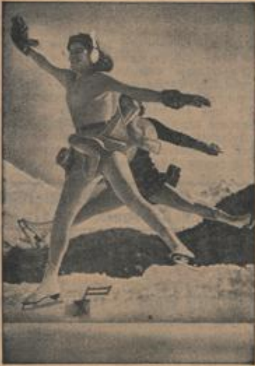
Große Freude über den Winter Mit einem Acrobatischen Sprung gehen diese Wäsklerinnen in St. Moritz hinein ins Wintervergnügen.