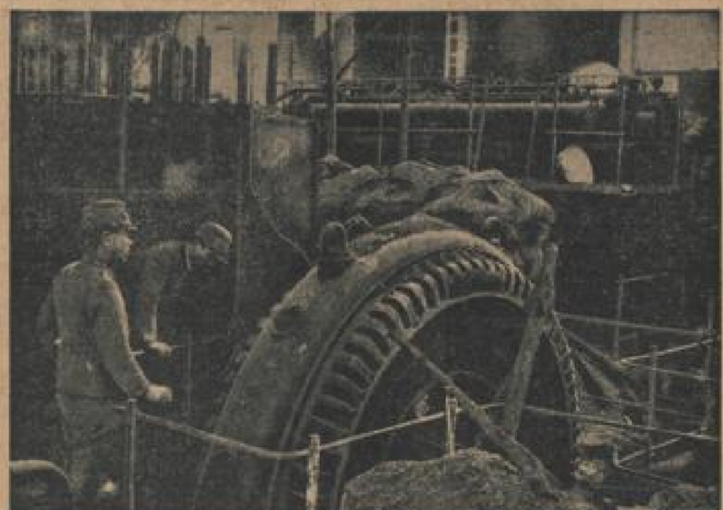
Sand in den Turbinen von Kanton. Es ist das Wasserwerk von Kanton aus, als die Japaner die Stadt besetzten. Die stehenden Schichten hatten einen Brand angelegt und viele Tonnen Sand in die Kabinen gemischt, so daß die Anlagen vollkommen unbrauchbar wurden.