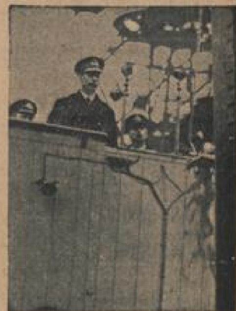
Georg VI. vollzieht die Taufe des neuen britischen Schiffschiffes „Georg V.“