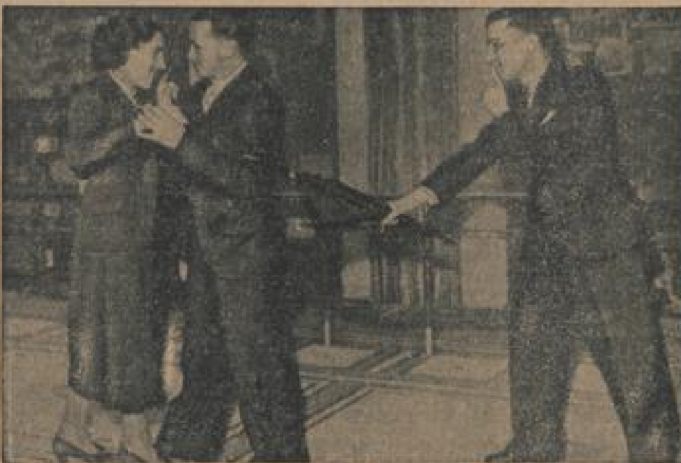
Langs „Abklatzen“ mit dem Chamberlain-Schirm. Ein französischer Langschiefer in Bosen nennt jetzt einen neuen Ein-Deck des „Chamberlain-Lang“. Natürlich bildet der Schirm des Ministerpräsidenten die einzige Verbindung mit Chamberlain, denn das bekannte „Abklatzen“ wird durch Einhalten mit einem Schirm beendet. (Schirmer, Sonder-Kultur-Verl.)