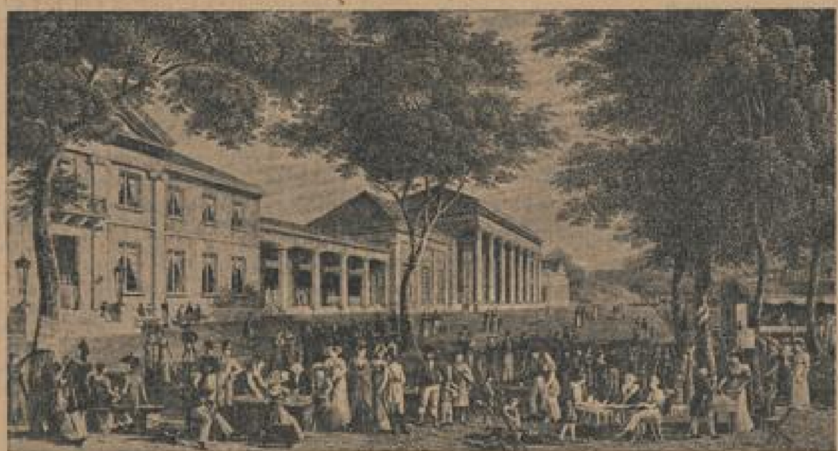
Vor 30 Jahren sah es so vor dem Baden-Badener Rathaus aus. Eine Lithographie aus der Zeit um 1810.

14. Febr., 23. Febr. Der für Ende April vorgesehene Dritte Internationale Kongress der Sanatorien und Privatanstalten, der unter der Schirmherrschaft des Reichsministers für die Gesundheitswesen steht, wird die Teilnehmer des Kongresses in einer besonderen Feierliche Eröffnung des Kongresses halt.