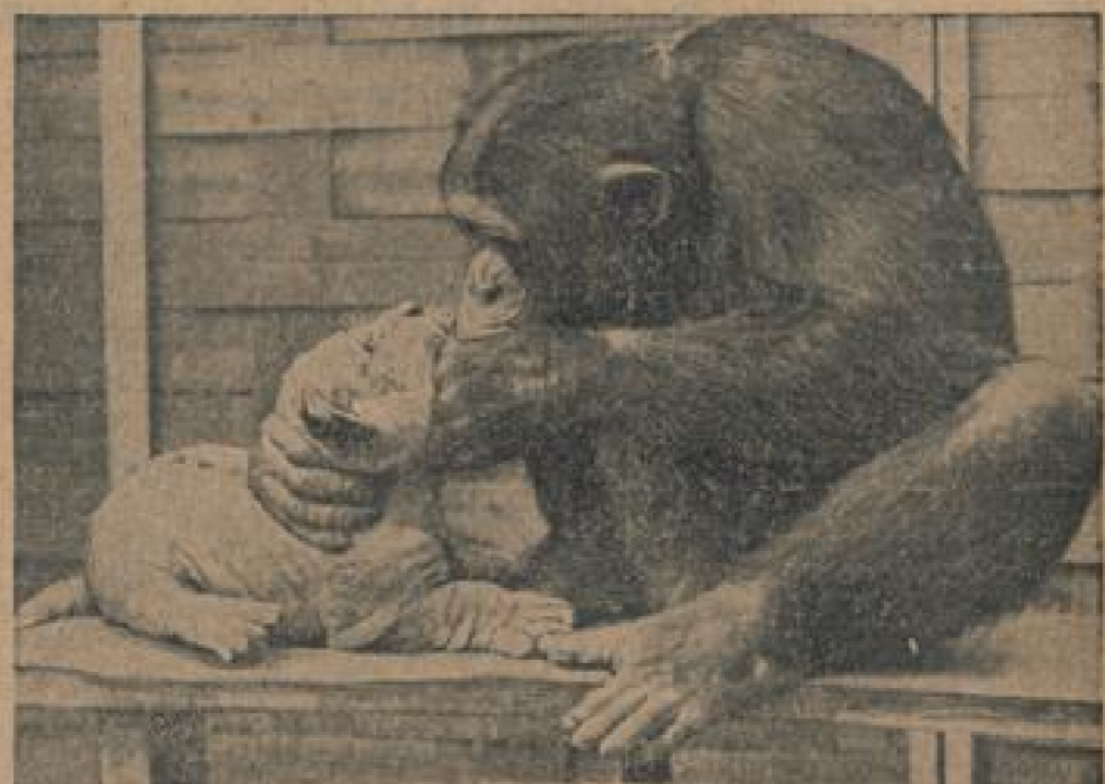
Was müssen die Fische...? Es scheint dieser Schimpanse das Löwenbabe, seinen Einzelgänger im Vondamer Zoo zu fragen. (Hilfisch, Sonder-Kultur-Verl.)