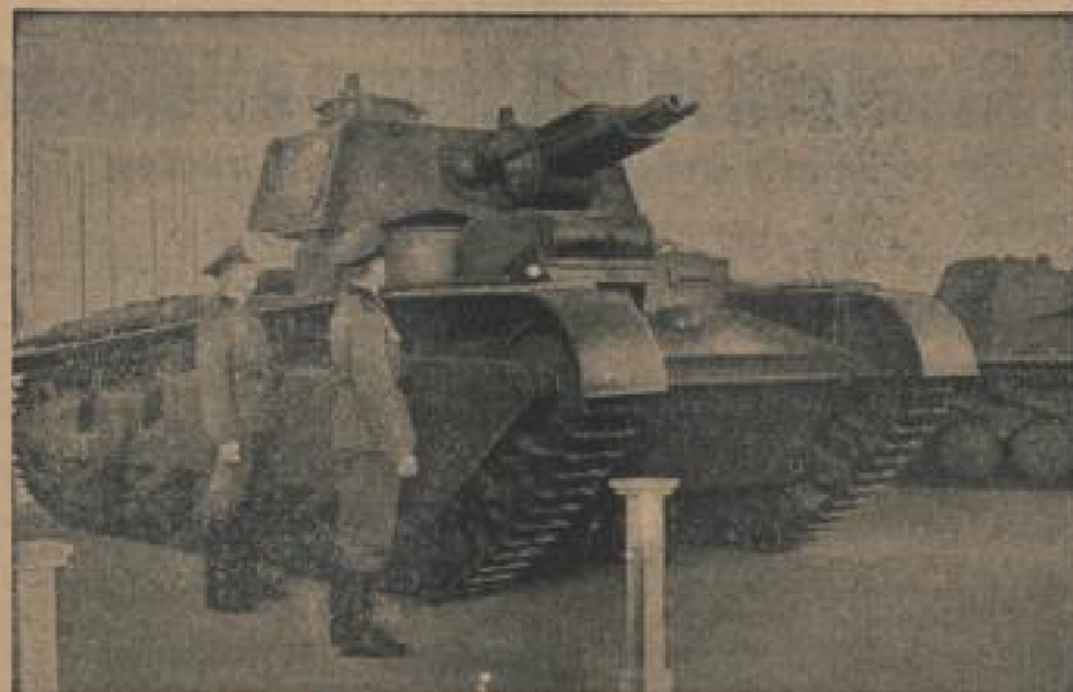
Auf der Internationalen Automobil-Ausstellung in Berlin zu sehen: Auf dem Band der Wehrmacht ist die beste gemaltete deutsche Kampfwagen zu sehen, der das besondere Interesse aller Besucher erweckt. (Schirmer, Sonder-Kultur-Verl.)