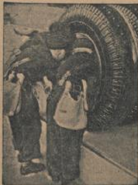
„Fahrlinie“ auf der Internationalen Automobil-Ausstellung. (Schirmer, Sonder-Kultur-Verl.)