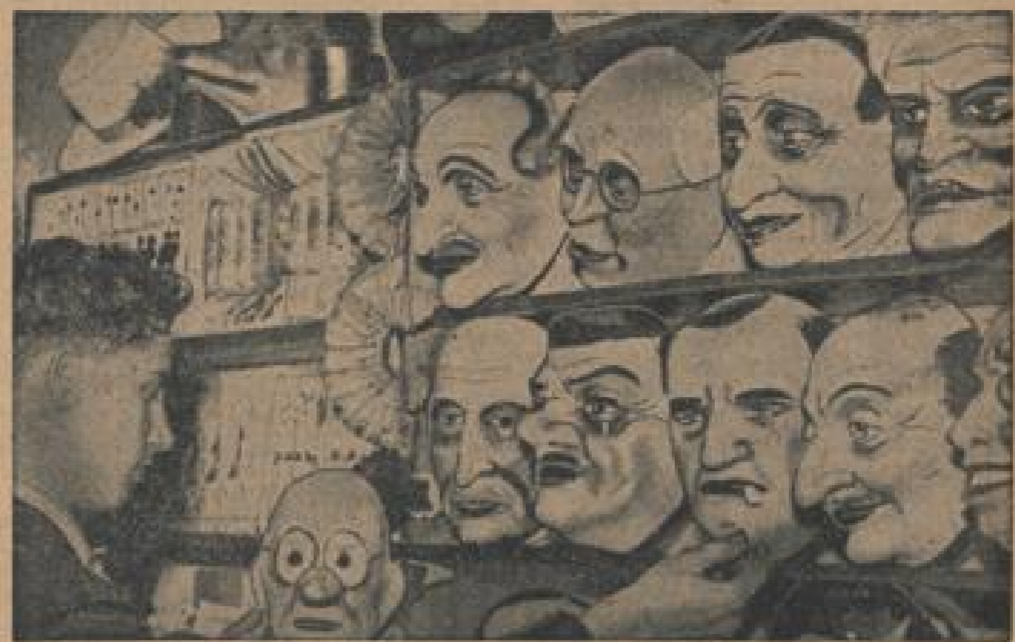
Wachung in der Maske des Ministers. Die Masken der französischen Minister waren die Schloßer der französischen Forderungsfabrikanten. Für wenig Geld konnte man Minister, ja sogar Premierminister für einige Stunden sein. (Hilfisch, Sonder-Kultur-Verl.)