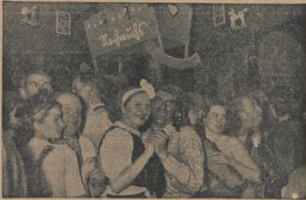
„Die Kaiserin ohne Krone“ wurde fröhlich gefeiert. Unter diesem Titel feierte die Berliner Presse mit Freuden und Aufgeschlossenheit die Thronbesteigung im „Haus der Presse“. (Hilfisch, Sonder-Kultur-Verl.)