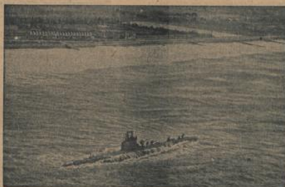
Britische U-Boote liefen auf Grund Zwei englische U-Boote „Sunfish“ und „Gardiner“ rissen sich infolge eines Sturmes von ihrer Verankerung bei der Insel Wight los und liefen auf Grund. — Unter Bild zeigt das U-Boot „Sunfish“. (Pfeiffer-Goffmann, Sonder-Multiplizier-Nr.)