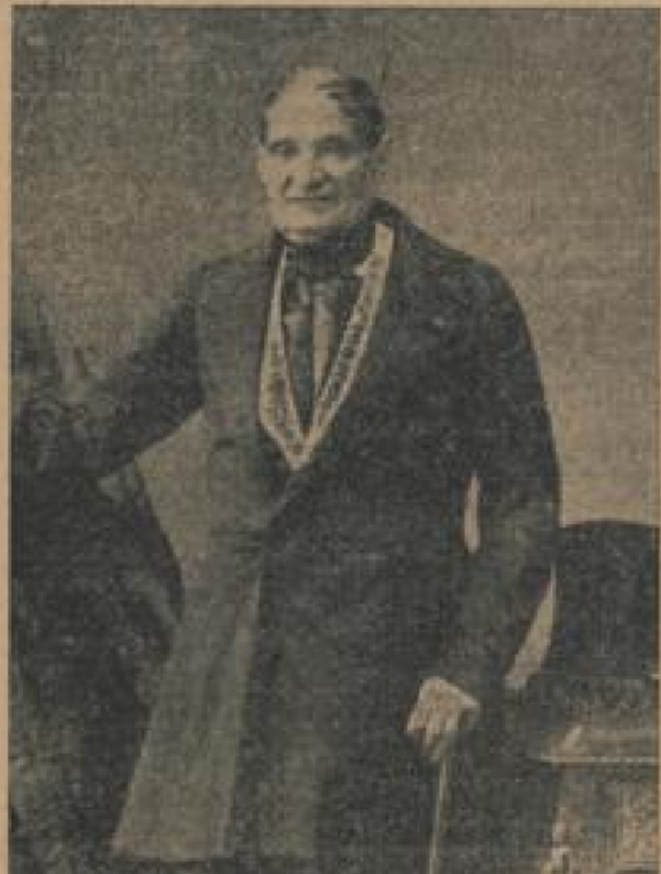
Prinz Jérôme Napoleon (1784—1860), der einstige „König Plonplon“ von Neapel, Bruder Napoleons I. Photo aus dem Jahre 1850. Camillea Donatelli

Graf Moray und Vicomte de Persigny, Napoleons vertrauter Freund seit dem Aufbruch von St. Cloud und Boulogne, treten hinzu. Moray sieht den Kaiser bedeutungslos an, nicht dann auf