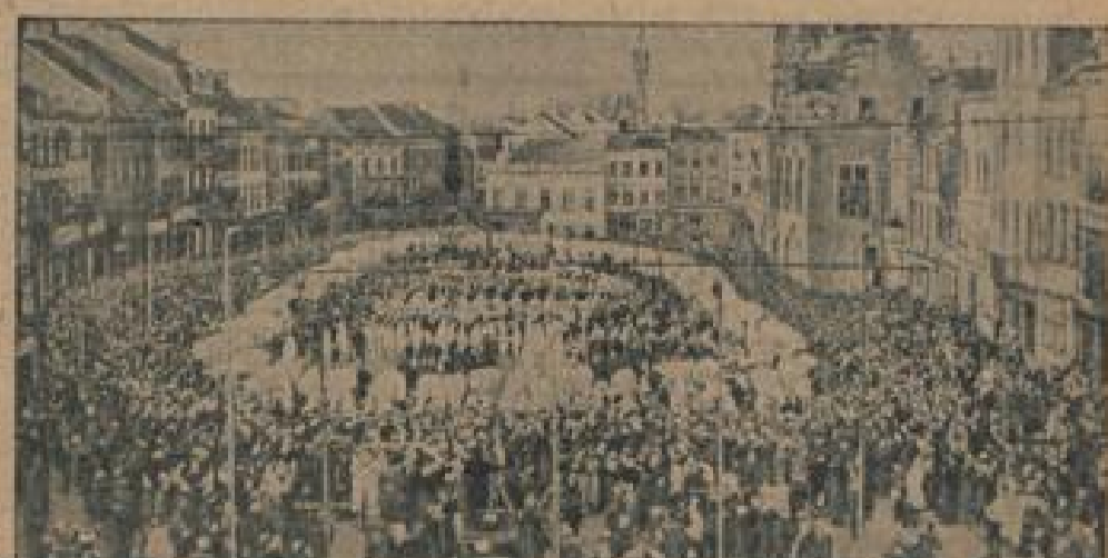
Belgien schönster Karneval Zum Abschluss und Höhepunkt waren Tausende aus den belgischen Provinzen zum Karneval nach der kleinen Stadt Binche geehrt.