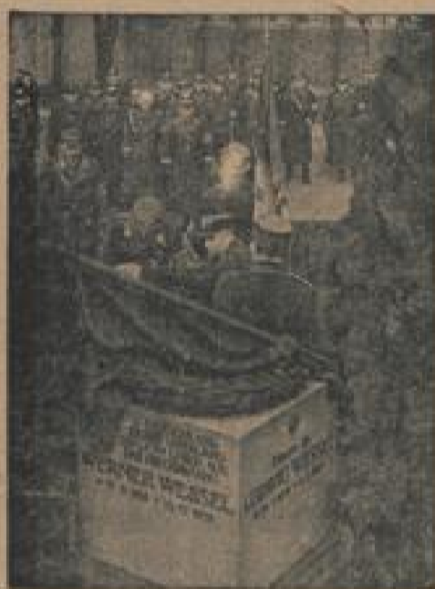
Der Stadtschef am Grabe Horst Wessels Am 2. Dezember Horst Wessels letzte Stadtschef Ruhe am Grabe auf dem Berliner Nikolai-Friedhof einen Kranz nieder.