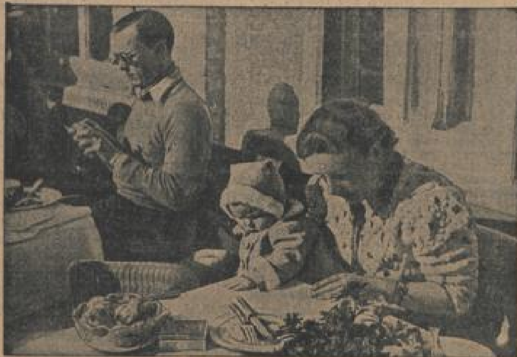
Kronprinzessin Juliane und Prinzgemahl Bernhard in der Schweiz Kronprinzessin Juliane und Prinzgemahl Bernhard von Holland sind mit ihrem Lehrling, Prinzessin Beatrix, zum Winteraufenthalt in Grindelwald in der Schweiz eingetroffen.