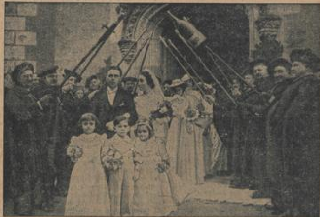
Ein Fröhlichkeit versprechendes Ehrenpalast von „Mittern des Meeres“, den Mitgliedern eines Wintervereins gebildet, unter diesen französische Frontsoldaten, welches in Brauns im Bergen der Weispropheten Fontaine getraut wurde.