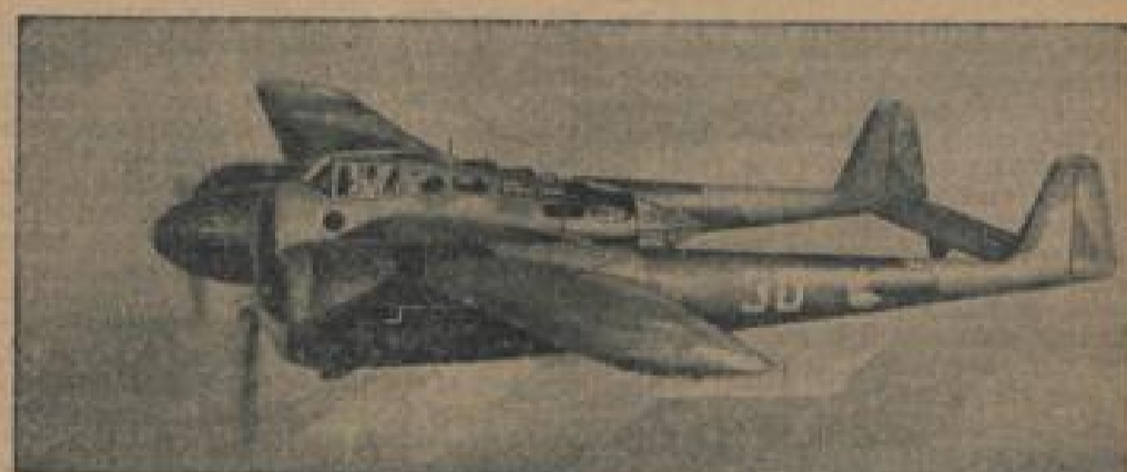
Die holländische Luftwaffe besitzt neuen neuen Jetter G.1 Höhen-Bomber mit doppeltem Schwanz, ein außerordentliches Flugzeug.