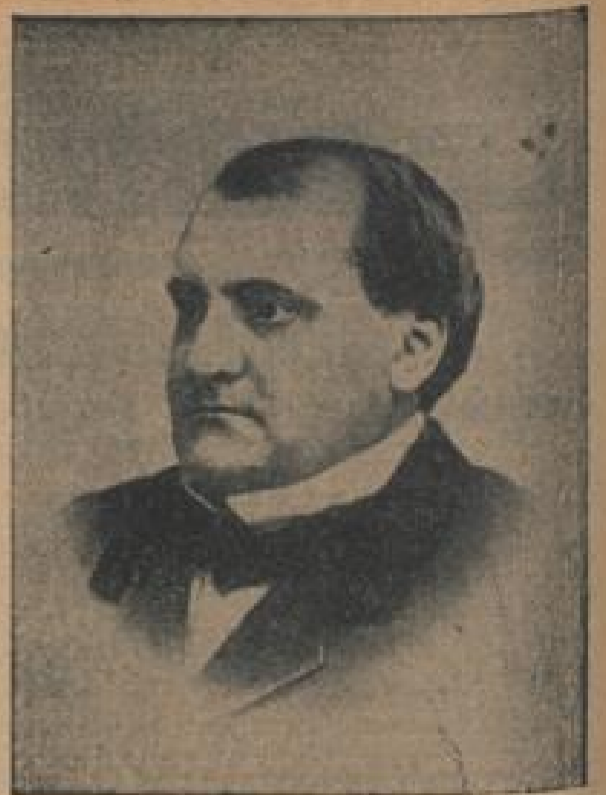
Prinz Napoleon (1822—1891), der Sohn von König Viktor. Der Volksmund besaß ihn mit dem Epitheton „Plonplon“. Er wurde durch die Thronbesteigung Napoleons III. die langgeheute Hoffnung erfüllt, Kaiser der Franzosen zu werden.

Ein hochherziges Ereignis, das bestimmt ist, die Regierung Sr. Kaiserlichen Majestät zu befestigen und die Fortdauer der Kaiserlichen Dynastie zu sichern, steht und brennt kurzem bevor. Der Kaiser wird sich mit Prinzessin Eugénie de Montijo, Gräfin von Leba, vermählen. Diese Vermählung wird am 22. d. M. den großen Staatskörperlichkeiten angezogen und am 23. d. M. vollzogen werden. Prinzessin Eugénie, eine Schwester der Herzogin von Alba, gehört einer der ersten spanischen Grafenfamilien an und ist durch Geist und Schönheit gleich ausgezeichnet, mithin der auf sie gefallenen Wahl in jeder Beziehung vollkommen würdig.