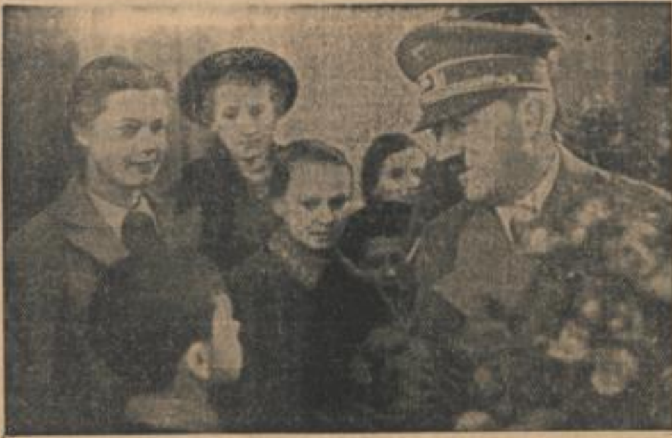
Der Führer in Brünn Der Führer wird in der tschechischen Hauptstadt von selbstbezüglichen Kindern begrüßt. (Presse-Gesellschaft, Zander-Multiplex-R.)