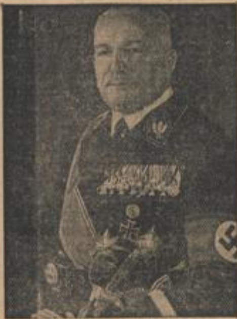
Dr. Herr von Neurath, der Reichsminister für Böhmen und Mähren