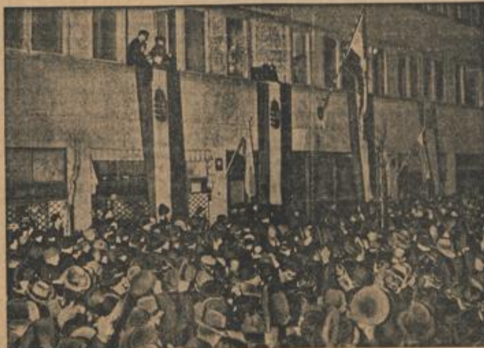
Studenten Demonstrationen in Warschau Aus Anlaß der neuen ungarischen-polnischen gemeinsamen Grenze fanden in Warschau vor der ungarischen Gesandtschaft große Studentendemonstrationen statt.