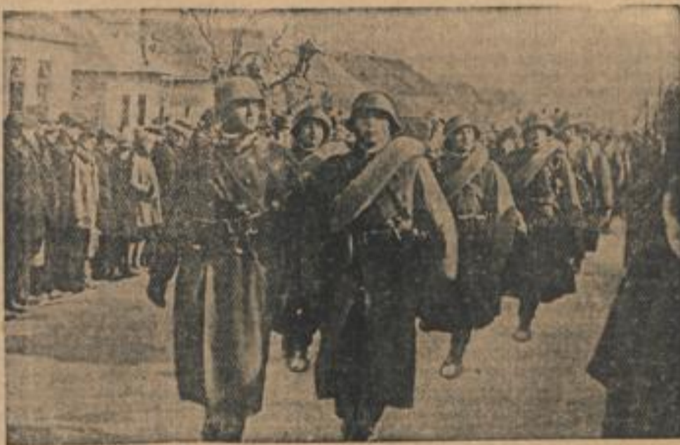
Der Einmarsch der ungarischen Truppen in die Karpatho-Ukraine Ungarische Infanterie bei der Besetzung des karpatho-ukrainischen Ortes Tolos in der Nähe der ungarischen Grenze.