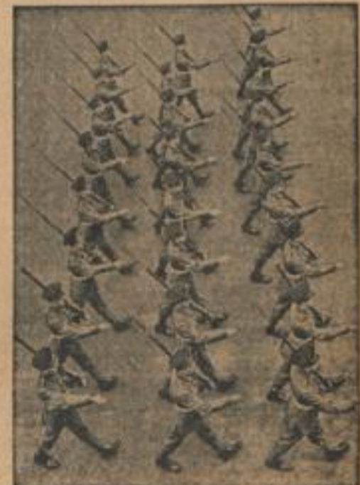
Englischer Drill Die englische Armee führt ein neues Überzieh-Kleidungsstück in Dreier-Formationen gegenüber dem bisherigen Überziehen in Vierer-Formationen ein.