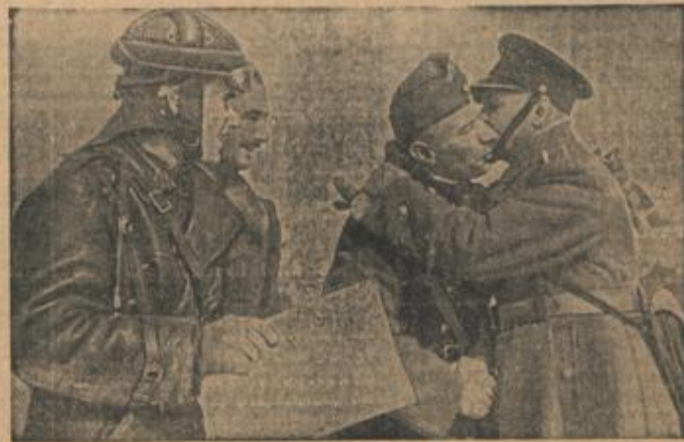
Erste Begegnung ungarischer und polnischer Soldaten an gemeinsamer Grenze Als erste der in der Karpatho-Ukraine einmarschierenden ungarischen Truppen fanden sich Mann einer Kavallerie-Patrouille polnischer Soldaten an der neuen gemeinsamen Grenze gegenüber.