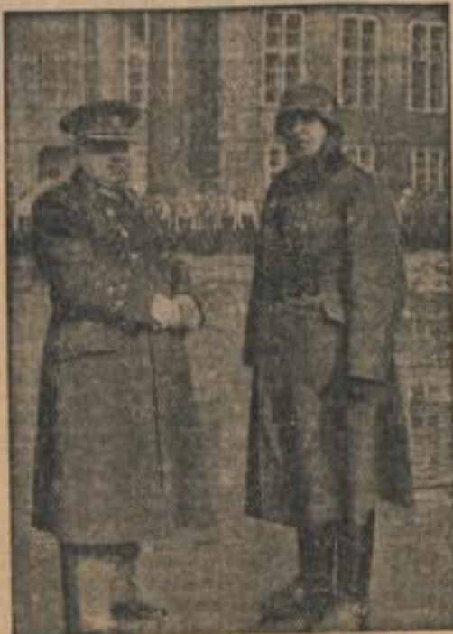
Marshall Siroun in der Prager Burg Am Tage der Abfahrt Adolf Hitlers aus Prag sah unser Bildberichterstatter auch im Gole der Prager Kaiserburg den tschechischen Marshall Siroun.