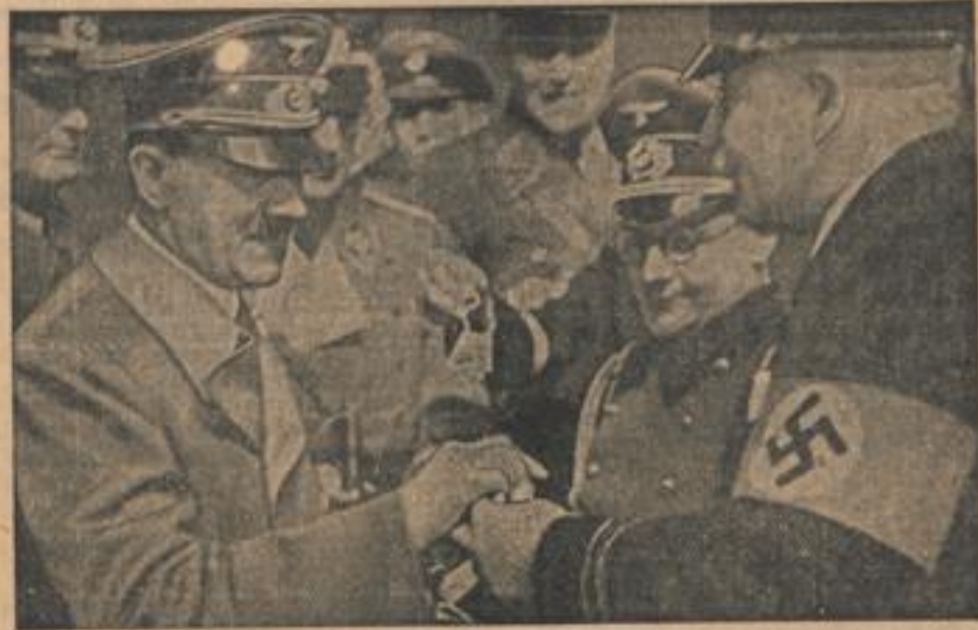
Des Führers Gabe für das NSD in Wien Weg vor seiner Abreise aus Wien spendet der Führer seine Gabe für das NSD zum Tage der Wehrmacht. Knapp rechts vom Führer erkennt man Dr. Gsch-Ingaurt, (Presse-Gesellschaft, Zander-Multiplex-R.)