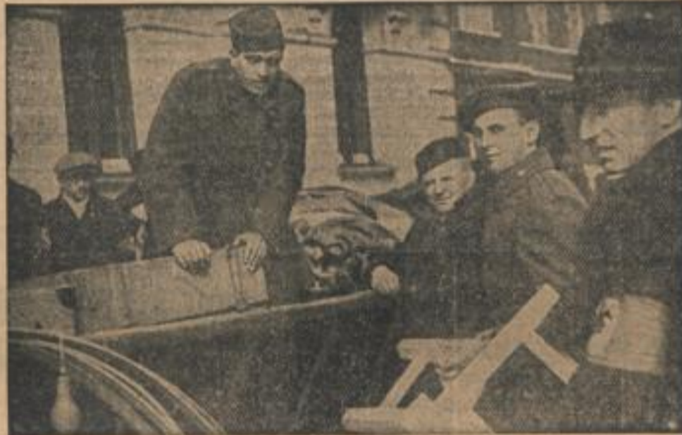
Tschechische Soldaten verlassen Pilsen Tschechische Soldaten der Pilsener Garnison beim Verladen der Waagen vor dem Verlassen der slowakischen Hauptstadt.