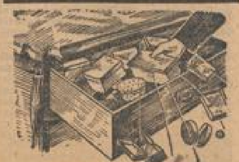
Auch ohne Schlüssel sind begabte als Altruisten sind sie von Wert

Schon wiederholt ist der Vorschlag, daß Autogrammwünsche nicht kriegswichtig sind, um für die Kriegsbanner die Autogrammwünsche nicht kriegswichtig sind.