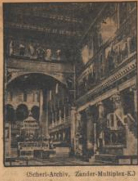
Die San-Lorenzo-Basilika in Rom zerstört. Bei dem Terrorangriff britisch-amerikanischer Flieger am Rom wurde auch die berühmte San-Lorenzo-Basilika...