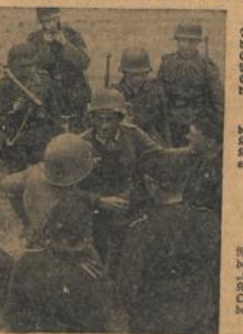
Nach harten Abwehrkämpfen im Osten Mittelfront... (R.N.Z.-Anf.-Kriegsbericht Stockholm, 7. 11.)

Was man damit zum Ausdruck bringen will, ist ganz offensichtlich: Mit beispiellosem Jähzorn bekannt sich England heute zum ausschließlich terroristischen Charakter seines Luftkrieges.