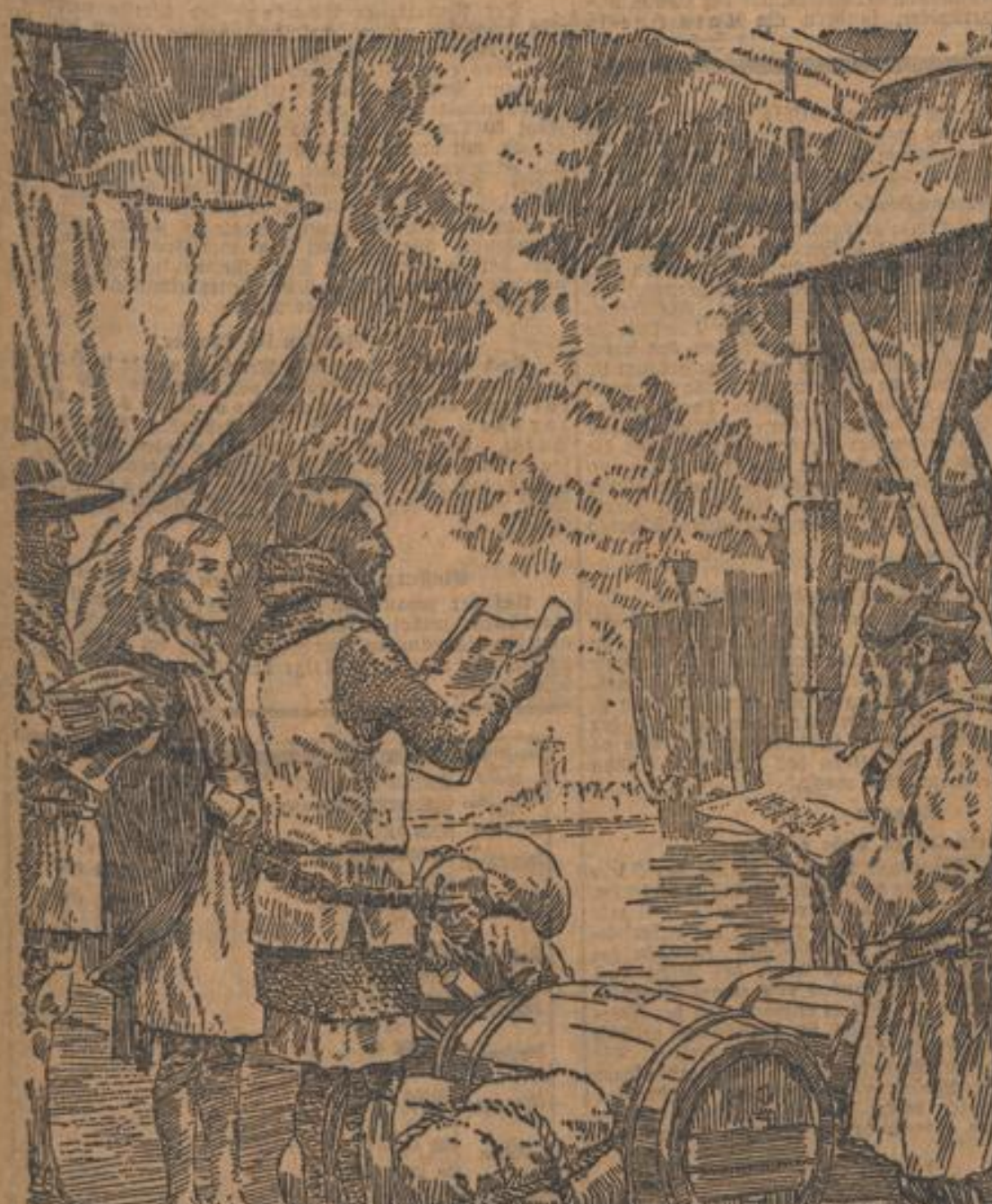
DIE RITTER OVERSTOLZEN ALS HANDELSHERREN

In Zeiten gefährvoller Kriegstürme griffen die Kölner Kaufherren zur Wehr und setzten ihr Leben ein für die Verteidigung der städtischen Freiheit. Auch die OVERSTOLZEN, ein Geschlecht, das mit dem höchsten Wappenschild der Stadt Köln verbunden ist, finden wir unter diesen Ritterkaufleuten. Als Eigentümer gefüllter Speicher und schwerbeladener Kauffahrtschiffe wirkten sie auch als Handelsherren für den Wohlstand ihrer Vaterstadt. Überall gilt heute die Bezeichnung OVERSTOLZ dem Raucher als Gewähr für hohe Qualität. Denn jede Zigarette, welche diesen Namen trägt, ist mit der gleichen Liebe und fachlichen Sorgfalt gefertigt, die den Kölner Handel und Kaufmannsgeist schon im Mittelalter zu Ruf und Ansehen gebracht haben. Haus Neuerburg HAUPTVERWALTUNG KÖLN OVERSTOLZ ist neuerdings auch in Packungen zu 10 Stück erhältlich.