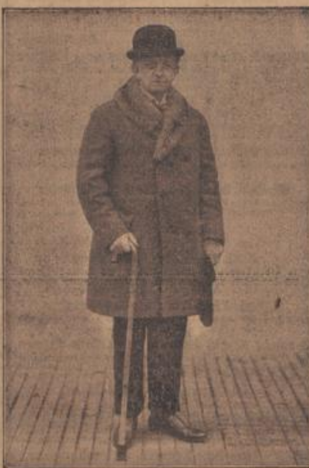
Graf Bernstorff, deutscher Vertreter in Genf Atlantic-Paris