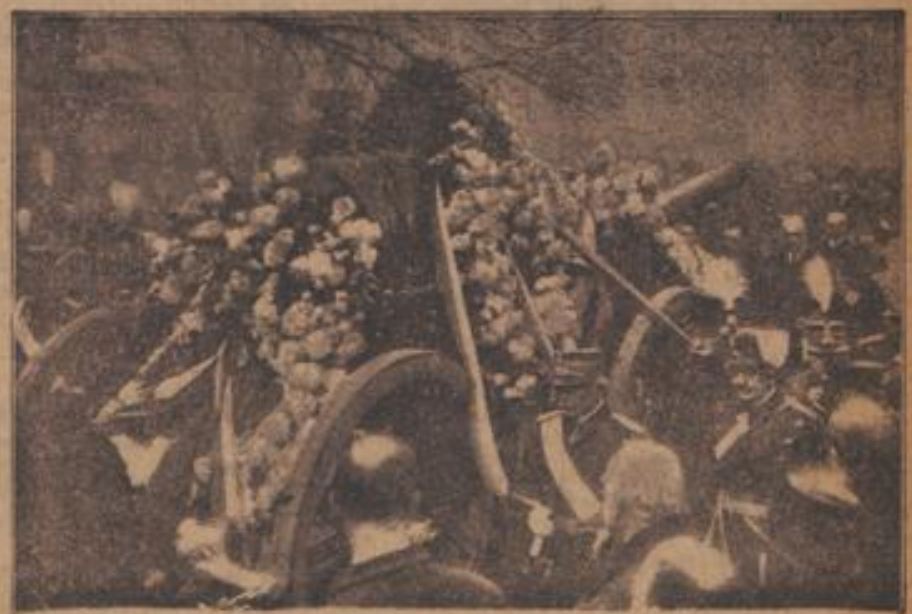
Die Besetzung Bratianu in Bukarest