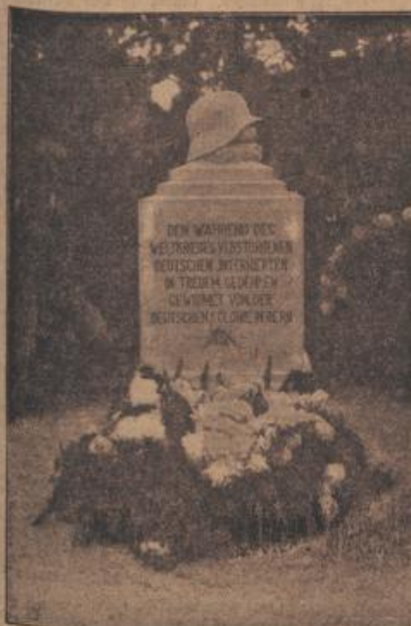
Gedenkstein für die während der Kriegszeit in der Schweiz internierten Deutschen