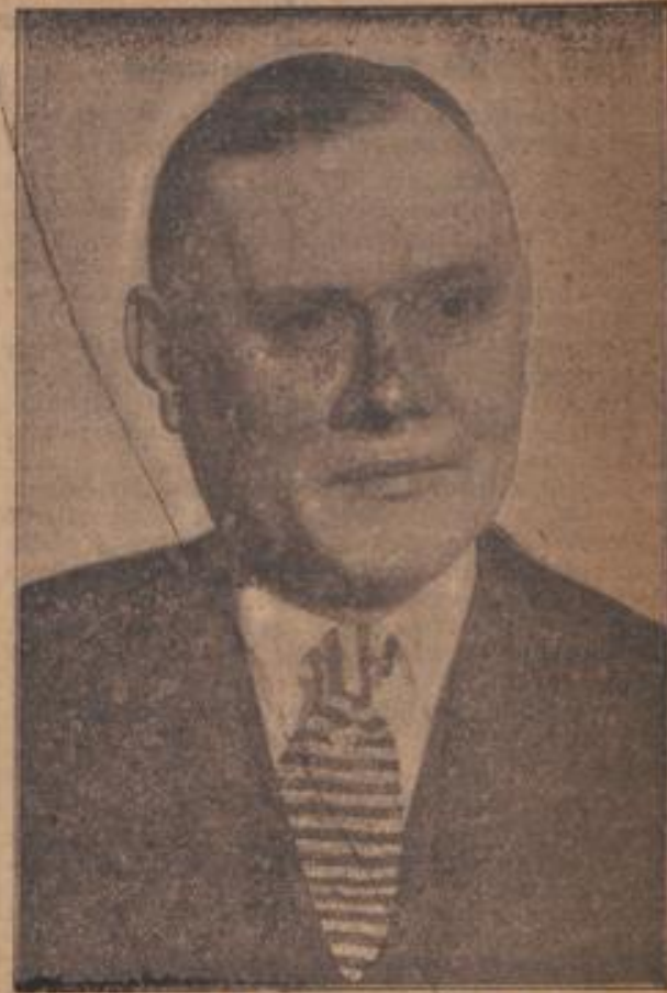
Der amerikanische Kongressabgeordnete William Green