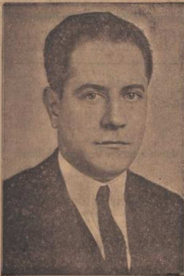
Weltschachmeister Capablanca kubanischer Gesandter