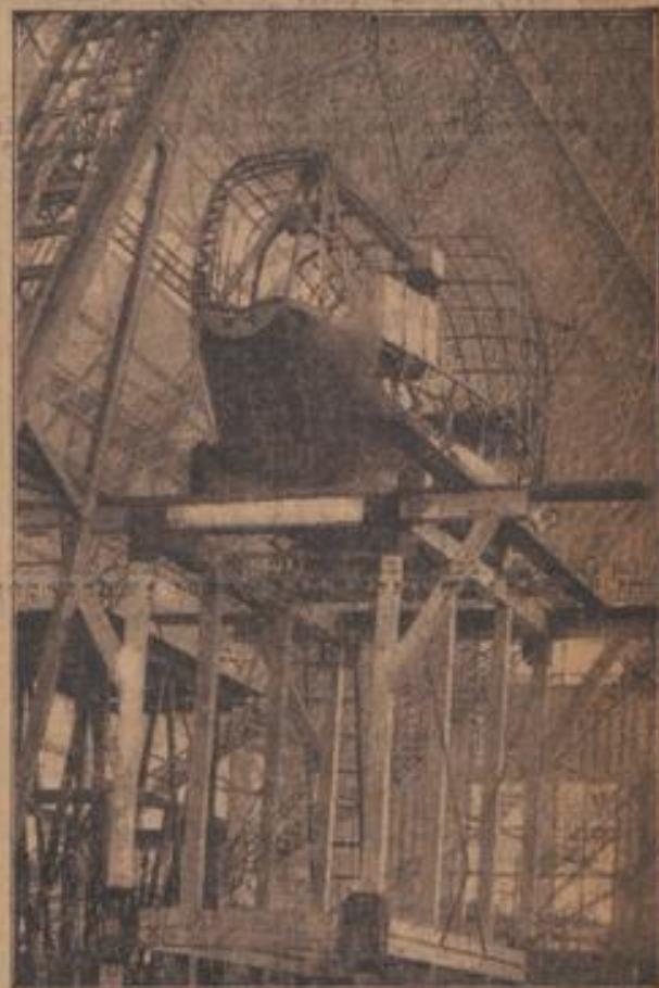
Das größte Luftschiff der Welt, L. Z. 127, wird in Friedrichshafen gebaut