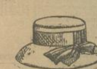
Mädchen-Glockenhüte mit Bandgarnitur St. 1.95, 1.45, 95, 75 Pf.

Enorm billig Moderne Blusen- und Miederrock-Nadeln in vielen Dessins, wie Emaille, Smilil etc. . . . . Stück 1.75, 95, 35 Pf. Hutnadeln in reichhaltiger Auswahl 95, 48, 28, 9 Pf.