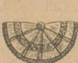
Tüll-Schleife mit Sammetknoten und Spitzeinsatz wie Abbildung Stück 48 Pf.