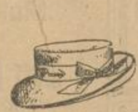
Knaben-Glockenhut mit Schriftband Stück 1.50 M.