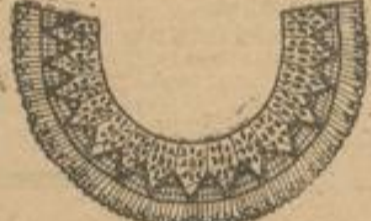
Pirette-Kragen mit Zackengarnitur wie Abbildung . . . . . Stück 48 Pf.