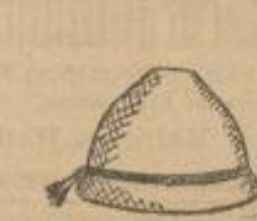
Seppel-Hüte weiss und grün Stück 75, 48, 28 Pf.