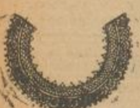
Damen-Blusen-Kragen aus Macramé, wie Abbildung . . . . . St. 48 Pf.

Korsetts Weisses Mieder-Korsetts Stück 78 Pf. Batist-Frack-Korsetts moderne Form oben kurz unten lang . . . . . Stück 2.75 M.