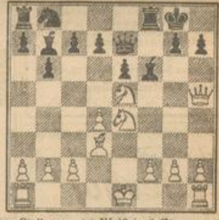
In dieser Stellung setzt Weiß in 3 Zügen mat durch: