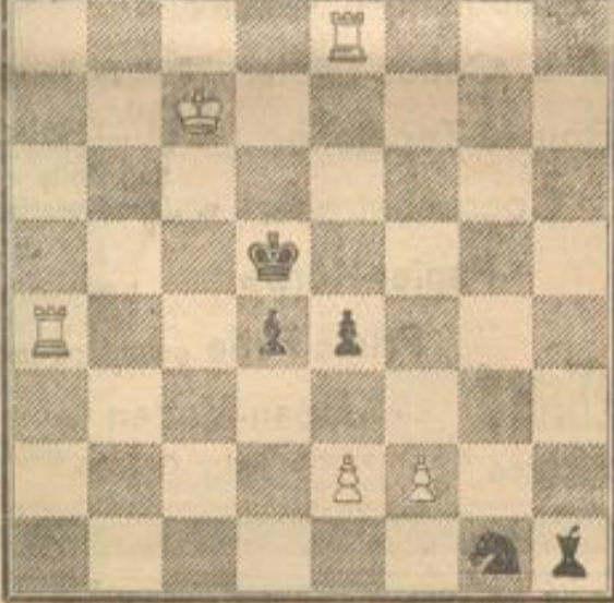
Mat in 4 Zügen.