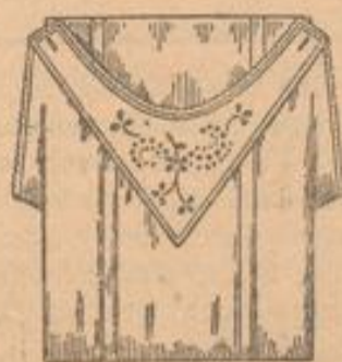
Madeira-Hemd mit reicher handgestickter Passe, aus kräftigem Hemdentuch wie Abbildung . . . Stück 1 48