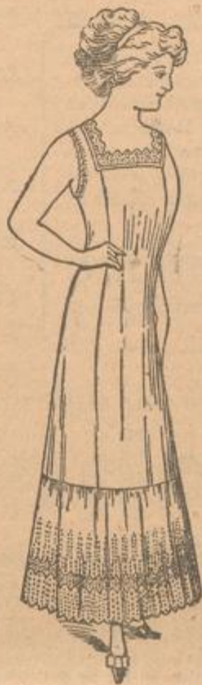
Prinzess-Rock mit breitem Stickerei-Volant und Stickerei-Besatz wie Abbildung . . . Stück 4 95

Aus weissem Stickereistoff mit Stickerei-Volant. Rosa oder hellblaue Unterlage. Reklampreis 95 Pf.