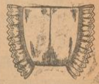
Beinkleid Kniefasson mit Stickerei-Ansatz wie Abbildung . . . Stück 95