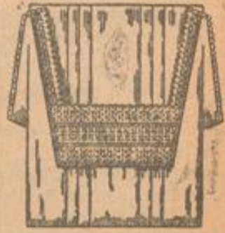
Reform-Hemd mit breit. Stickerei-Ausführung hervorragend in schöner Qualität . . . Stück 1 85