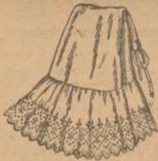
Stickerei-Rock aus eigener Anfertigung wie Abbildung . . . Stück 2 75 M.