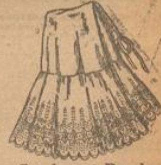
Stickerei-Rock mit hochbesticktem Volant wie Abbildung . . . Stück 3 95 M.