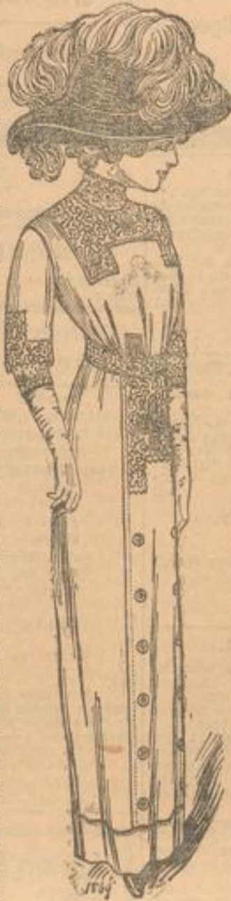
1868. Kleid mit reicher Soutacheierung.

Neben dem Kostüm, das nach wie vor seinen Platz behauptet, erfreuen sich auch die langen Mäntel, die in den letzten Jahren fast allein herrschten, wiederum einer gewissen Beliebtheit. Wer viel hinaus ins Freie muß, vielleicht täglich zur Berufstätigkeit eilt, kann des langen Mantels nicht entraten. Besonders jene nicht, die erst gegen Abend wieder nach Hause kommen. Wie oft passiert es, daß man beim schönsten Sonnenschein, bei wolkenlosem Himmel frühmorgens das Haus verläßt und unter strömendem Regen abends nach Hause kommt. Wie angenehm ist es dann, wenn man sein Kleid durch den langen Mantel schützen konnte, den man vorsorglich mitnahm. Auch für Ausflüge ist er bei dem heutigen, raschen Wetterwechsel überaus praktisch. Zudem schützt er auch gegen Staub, ohne zu belästigen. Als Material für diese Mäntel, die am vorteilhaftesten in Hellgrau und Beige gewählt werden, dienen Cheviot, Popeline und Covercoat; von den Wäschstoffen ist Baßseide in fester Qualität dem Leinen vorzuziehen, da dieses fast nach jedesmaligem Tragen aufgebügelt werden muß. Will man einen solchen Mantel nur als Regenmantel tragen, erwählt sich dunkelblauer, imprägnierter Cheviot als