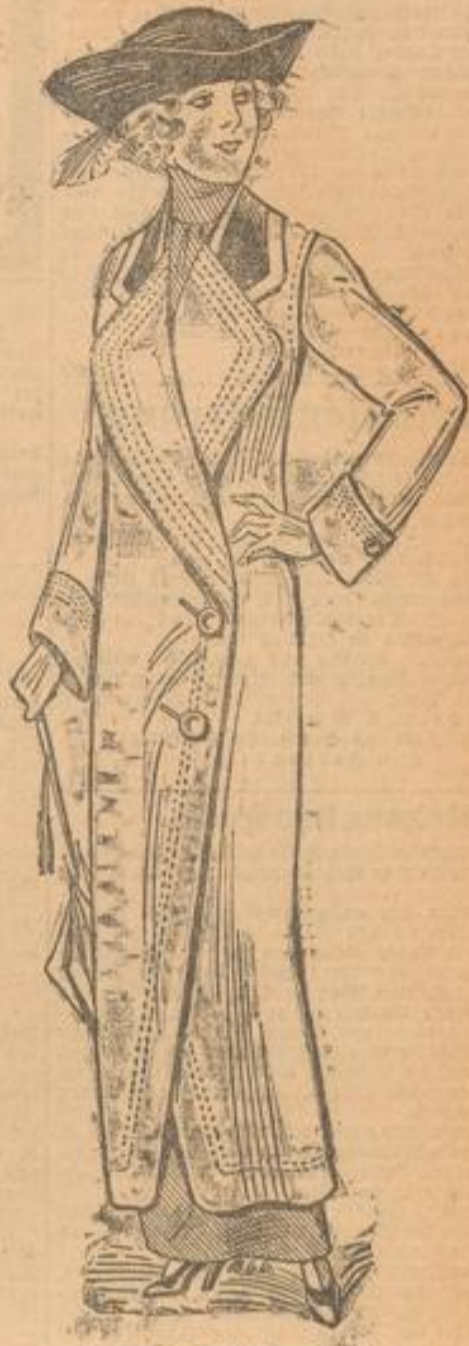
1866. Mantel mit Revers und Steppverzierungen.

1866. Mantel mit Revers und Steppverzierungen. Diagonal-Chieviot in einem hellen Grau-Beige ergab nebst grünem Samt das Material. Während die Vorderbahnen zu tiefem Schluß breit übereinandertreten und nach unten abgerundet sind, sind dem Rücken die äußeren Teile in sparter Schweißung zweimal aufgesteift. Ärmel. Der Manschettenrand ist am Rand zunächst etwa 2 Zentimeter breit mit Oberstoff, im übrigen mit Samt besetzt. Die Revers erhalten Oberstoffbesetzung und sind vierfach durchsteift. Hiermit harmonisieren die Wäschstetzausschnitte.