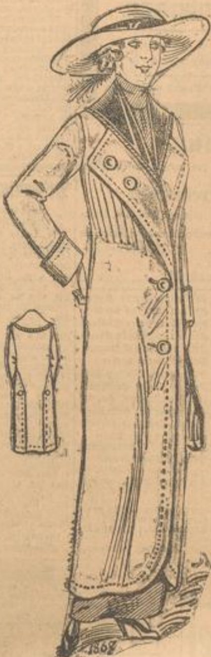
1867. Langer Mantel mit Schalkragen und Revers.

Sämtliche Schnittmuster in allen Größen, in den Normalschnitten 44 u. 46 liefert unsere Expedition an die Abonnenten gegen den billigen Preis von nur 50 Pf. pro Stk.