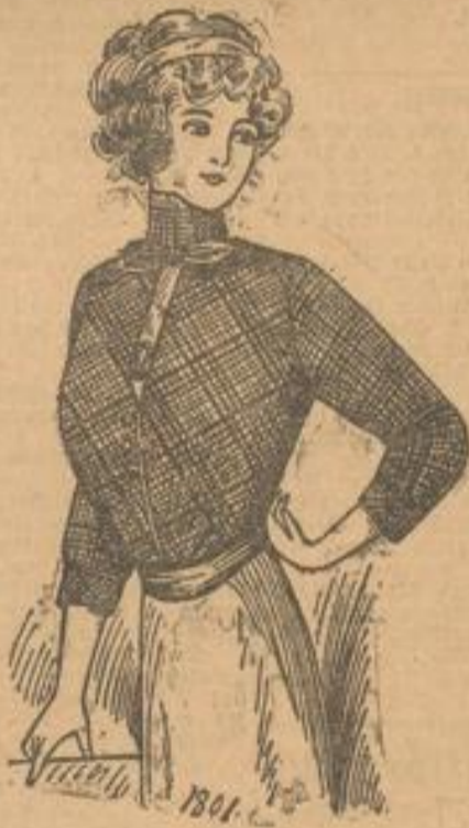
1801. Bluse aus blau-grüner Schotenseide mit kleiner Kravatte.

1801. Bluse aus blau-grüner Schotenseide mit kleiner Kravatte. Die Schotenseide unserer Vorlage ist für die glatte Tülle schräg, für die dreiviertellangen Ärmel gerade verarbeitet. Den rechten, zum Schluß übergreifenden Manschetten begrenzt ein heller Vorstoß, den einige Knöpfe begleiten. Glatte Seide besetzt auch die obere Hälfte des Vorderabschnitts, bildet die obere je vier abgerundeten Enden bestechende Kravatte und schließt den Stehkragen ab. Die Ärmel erhalten ein Bündchen aus schräger Seide mit Vorstoß.