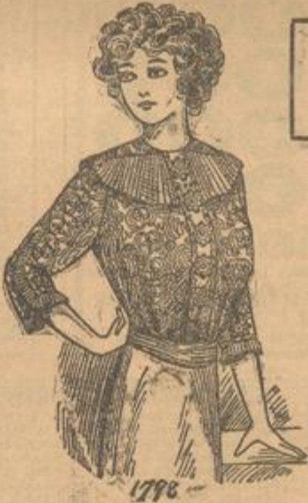
1798. Bluse aus Spitzenstoff mit Blüsegarnitur.

1798. Bluse aus Spitzenstoff mit Blüsegarnitur. Der gedrungene Spitzenstoff unserer Vorlage ist über weißer Seide gearbeitet. Die Taillenteile sind oben glatt und nur unten leicht angehoben. Der Vorderabschnitt bedeckt ein Spachtel-einschlag. Am Hals legt sich ein Kroge aus glattem, plüschtem Tüll, den noch spitzverlaufende Spannetten aus gleichfarbiger Seide garnieren. Der dreiviertellange Kermel schließt unten mit einem Plüssee ab, das außen bis kurz über den Ellbogen ansteigt.