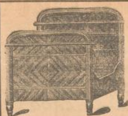
Englische Bettstelle echt Nussbaum furn. innen Eiche 45 00 Mk.

Aufmerksam machen wir auf nebenstehendes Angebot, die Preise hierfür sind netto.