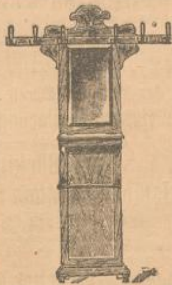
Flurgarderobe 18 00 Mk. Hellerle mit Facettenspiegel