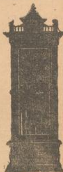
Trumeau 31 50 m. Facettenspiegel Mk.