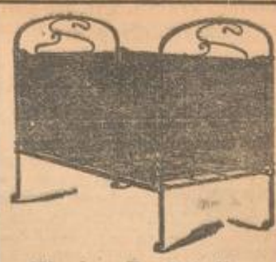
Kinder-Bettstellen mit 10 Prozent Rabatt