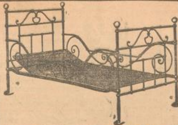
Grosse Eisenbettstellen mit 10 Prozent Rabatt