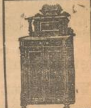
Vertiko mit Spiegel 29 50 Mk.