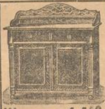
Waschschrank 14 50 Mk.