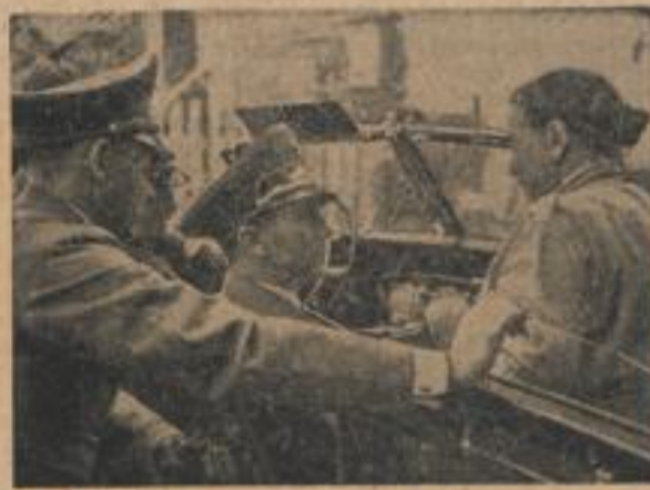
Dr. Goebbels besuchte die luftgelährdeten Westgebiete

wurde, wie das Oberkommando der Wehrmacht bekannt gab, durch ein deutsches U-Bootboot in den westlichen Mittelmeer aus einem fast gesicherten Geleitzug mit vier Torpedoträgern versenkt.