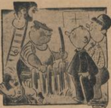
Gespräche über's Jaus

Generaloberst Arndt von Röhren, unter dessen Führung die fliegenden Verbände der Luftwaffe standen, die an der Verfolgung der Sowjetarmee westlich Ostpreußen beteiligt waren, in seinem Flugzeug.