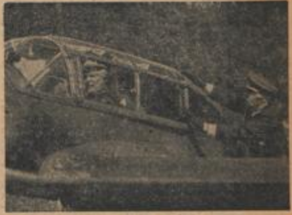
Vor dem Start zum Flug über das Kampfgelände

Der Reichsminister im Gespräch mit einer Döfelfeldererin. Die ihm die Schäden, die sie und ihre Familie durch den Bombenangriff der Engländer erlitten haben, schildert.