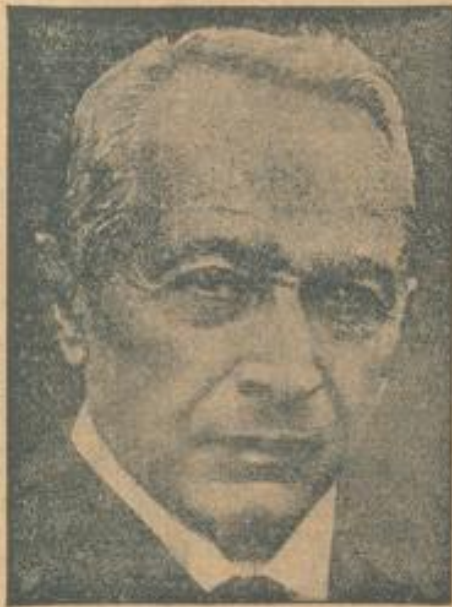
Prof. Junkers der Erbauer des Ozeanflugzeugs