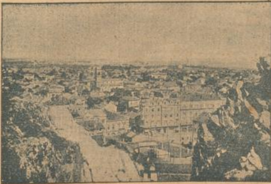
Das fast völlig zerstörte Philippopol