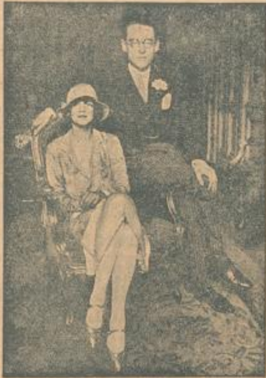
Fürst Otto von Bismarck und seine junge Frau