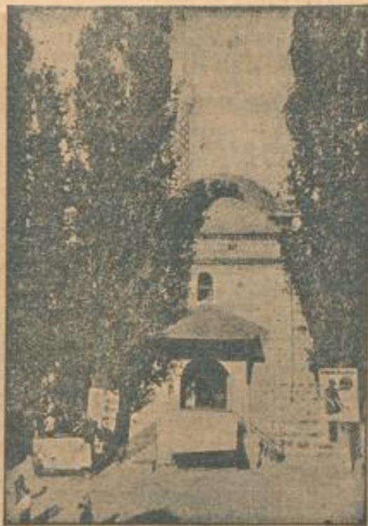
Das Erdbeben in Bulgarien: Eine Moschee in Philippopol, die vernichtet wurde