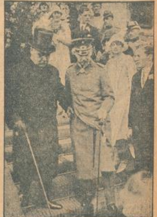
Reichspräsident v. Hindenburg mit seinem Sohn beim Verlassen der Kirche nach der Trauung des Fürsten Bismarck