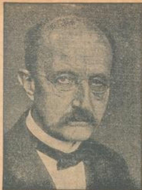
Der berühmte Physiker Max Planck 70 Jahre