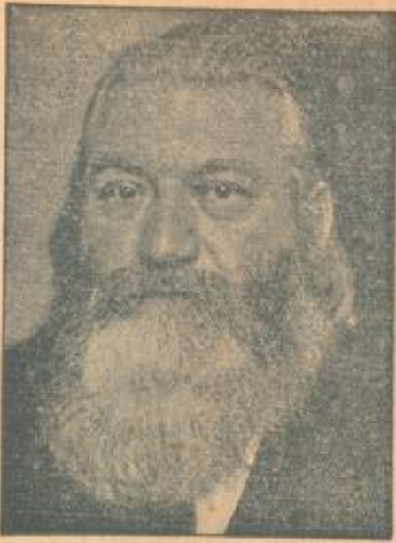
Theodor Däubler, der neue Präsident des P.E.N.-Clubs