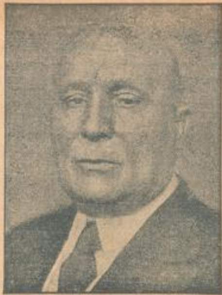
Senator Morello, der Präsident des internationalen Autorenkongresses