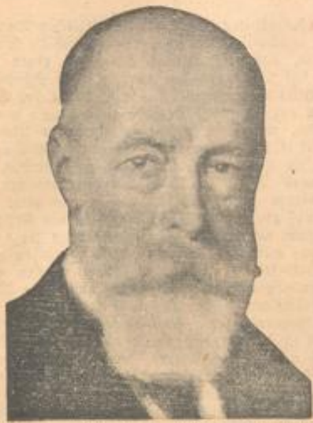
Der österreich. Bundespräsident Hainisch tritt Ende November zurück