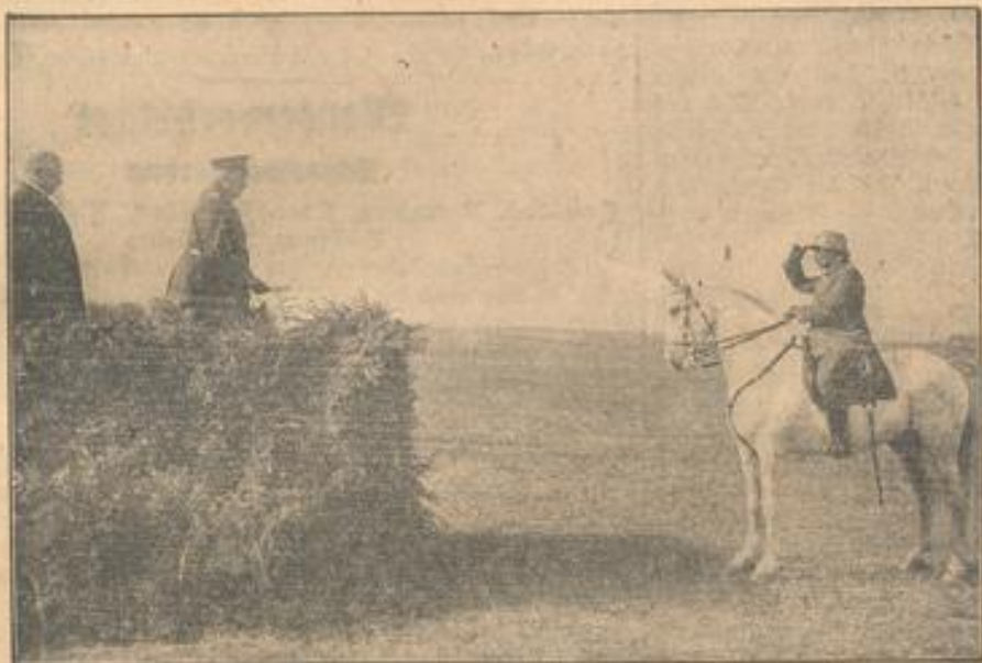
Die große Hindenburg-Parade vor Görlitz. Der Reichspräsident und Reichswehrminister Groener Deutsche Presse-Photo-Zentrale Berlin.