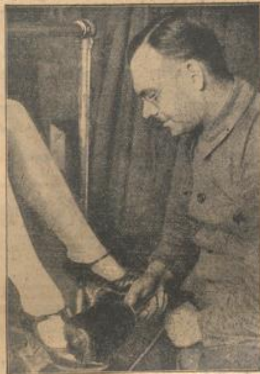
Der erste elektrische Stiefelputzer in Berlin