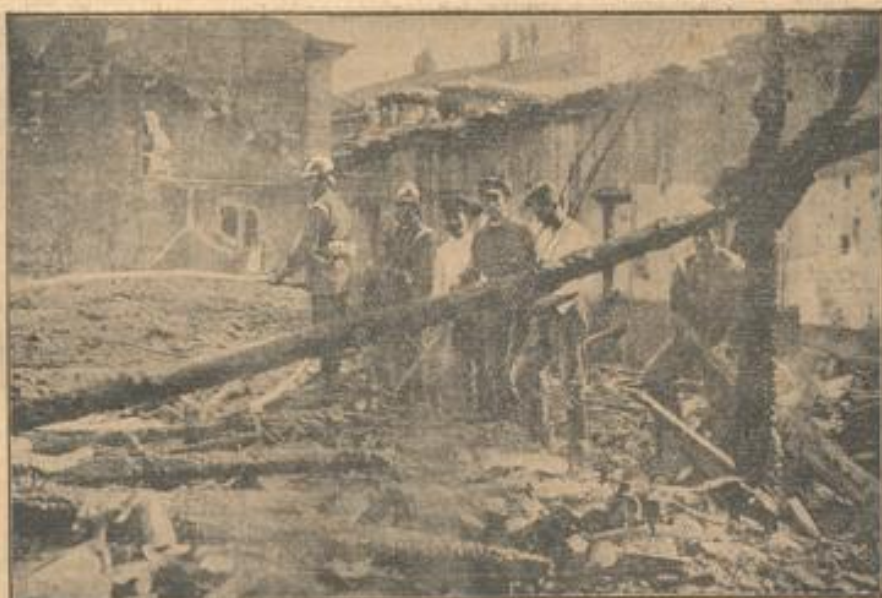
Der Trümmerhaufen des Theaters Novedades in Madrid Deutsche Presse-Photo-Zentrale Berlin.