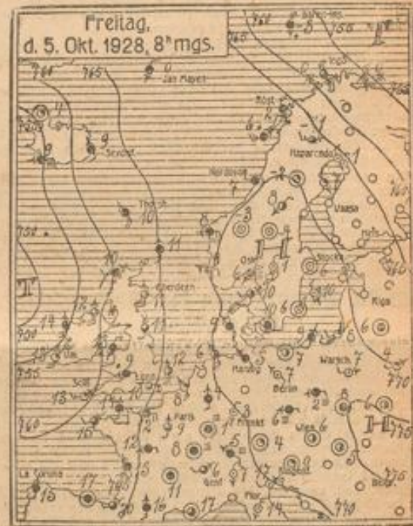
Freitag, d. 5. Okt. 1928, 8 mgs. Wetterkarte mit Druck-, Wind- und Temperaturangaben.

Um dieses Vorwärtsschreiten aber auch recht ins Auge fallend zu machen, ist außer Monatsabschluss und Hauptbuchauszug, geordnet nach Kunden, Lieferanten, Hypotheken und sonstigen Debitoren und Kreditoren, noch ein Statusbogen nötig, auf welchem immer der letzte Monatsstatus neben dem vorigen steht. Der Bogen hat dreizehn Betragspalten und eine Textspalte. Die Betragspalten sind für den ersten Tag des Geschäftsjahres und jeden letzten der zwölf Monate. In die Textspalte schreibt man die Titel der Aktivposten, darunter die der Passiva, dann folgen die Einnahmen für Waren, Mieten usw., dann die Ausgaben für Löhne, Geschäftskosten, Steuern, Hauskosten, Haushalt usw., der steuerpflichtige Umsatz u. a. m. Dieser Statusbogen gibt ein übersichtliches, klares Bild des Vorwärtsschreitens und ich möchte es zurufen allen, die es angeht: „Nüchtern Statusbogen!“