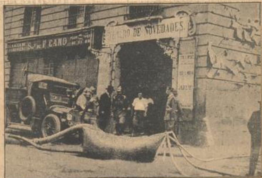
Eingang des abgebrannten Theaters Novedades in Madrid

Der österreichische Bundespräsident Dr. Hainisch wird im November von seinem Amt zurücktreten.