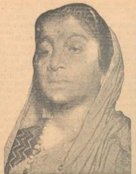
Die berühmteste Frau Indiens, Sarojini Naidu, in Berlin