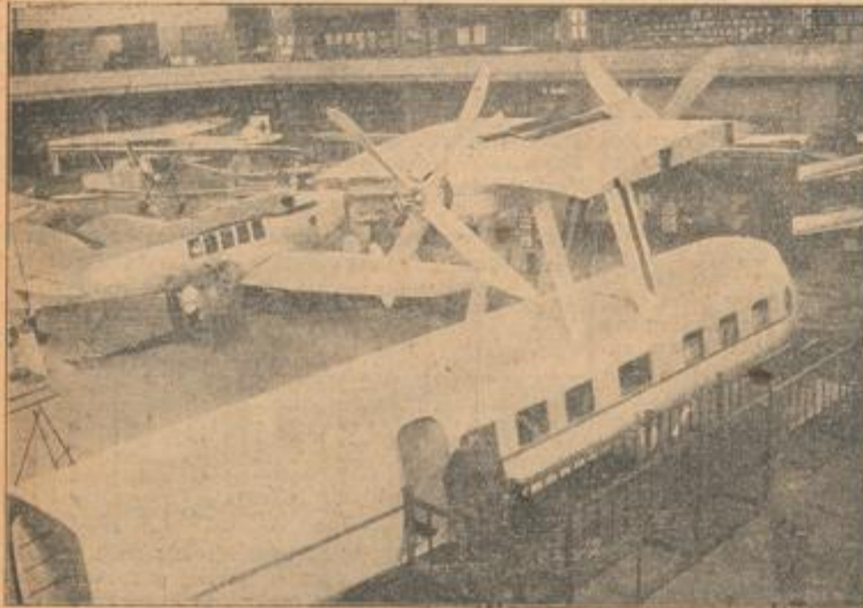
Franz. Riesen-Farman, 1000 PS, 200 km Geschwindigkeit