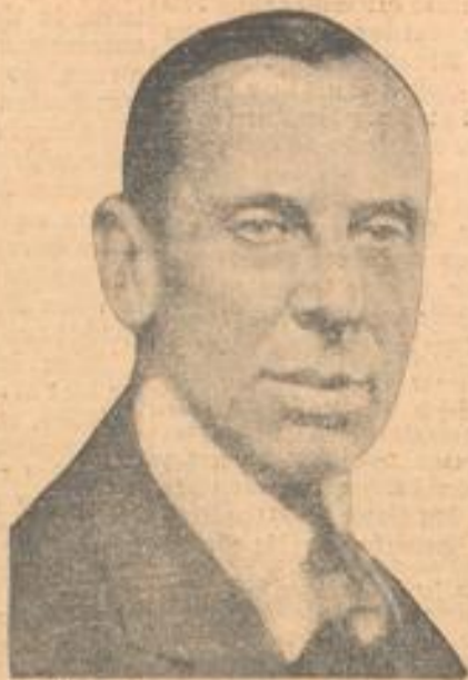
Der Automobilkönig A. P. Sloan in Berlin