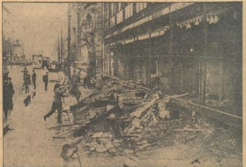
Die ausgebrannten Schaufenster