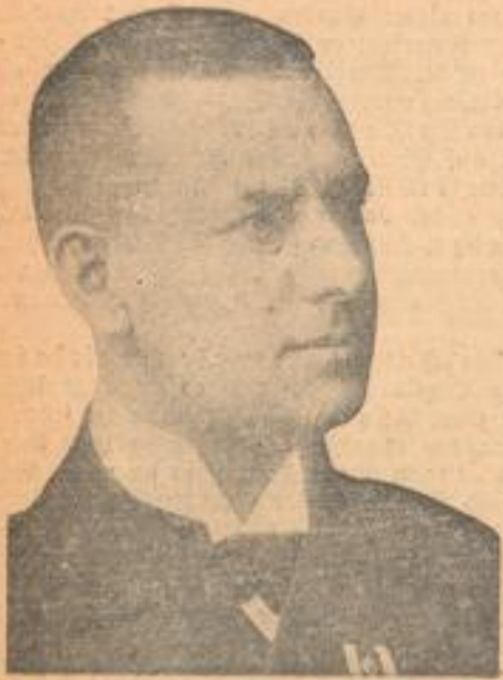
Der neue Chef der deutschen Marine Vizeadmiral Dr. h. c. Raeder