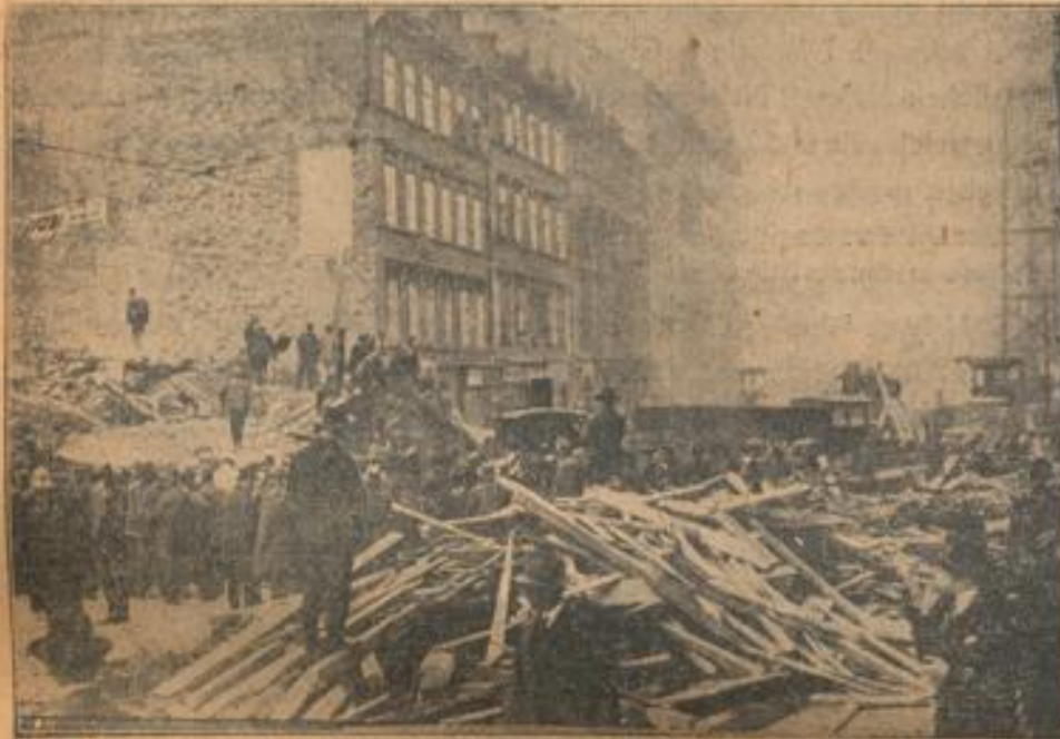
Uebersichtsbild der Unglücksstätte