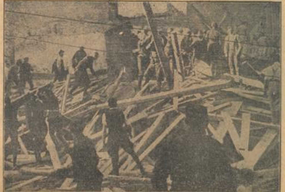
Bei den Aufräumarbeiten