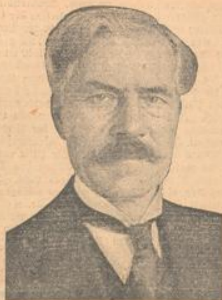
Der englische Arbeiterführer Macdonald spricht im deutschen Reichstag