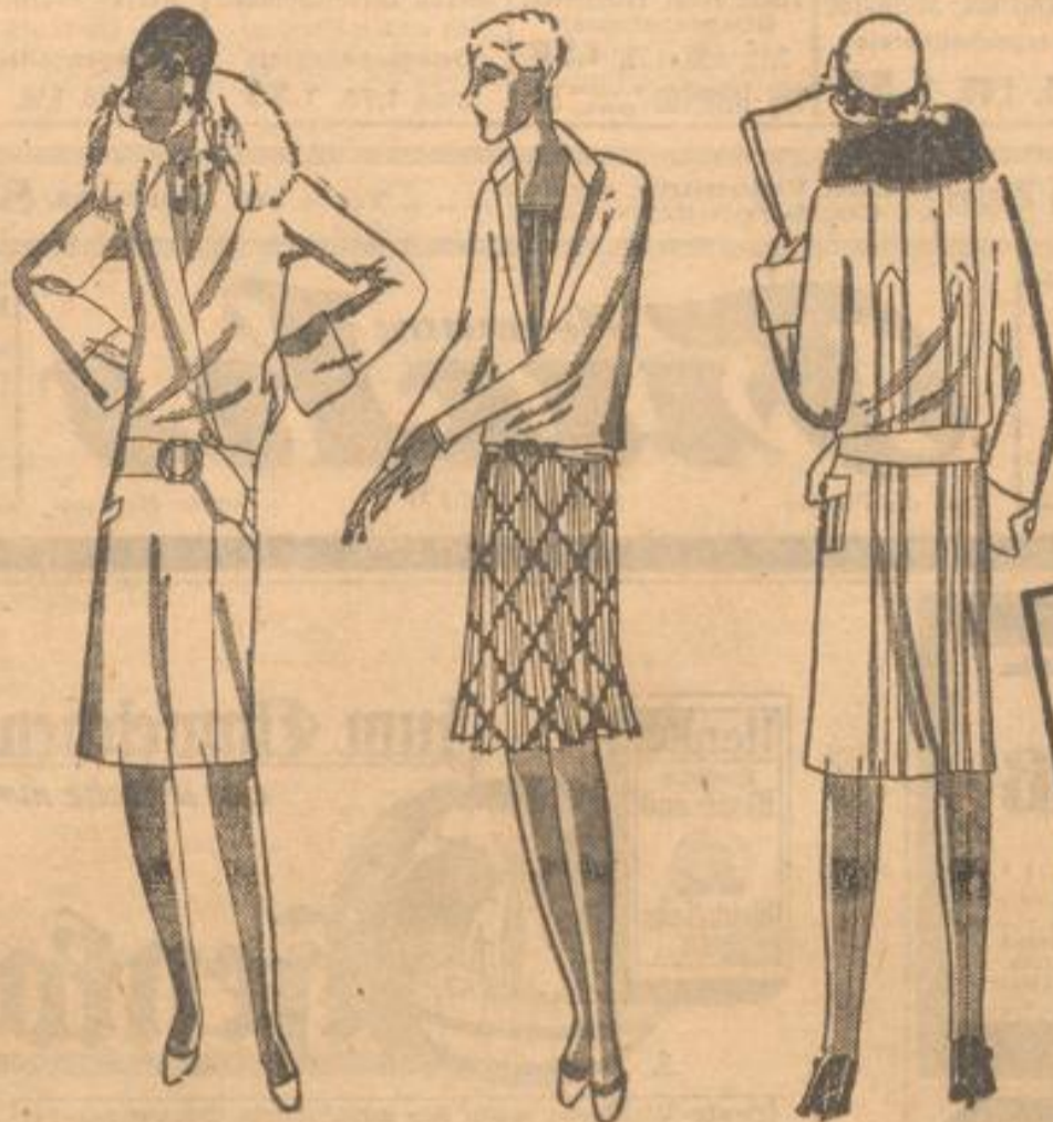
Der jugendliche Mantel in kleingemustertem Pantaleonstoff mit großem, kleinem, Pelzragen und modernem, breitem Gürtel 25 00

Wo auch immer Sie sich zeigen. Überall wird man Sie wegen Ihrer guten Kleidungs bewundern. Zuerst aber fragen Sie einmal den Spiegel in unserer Anprobekabine, welches der soeben eingetragenen Mäntel, welches der neuen Kleider Ihr Eigentum werden soll.