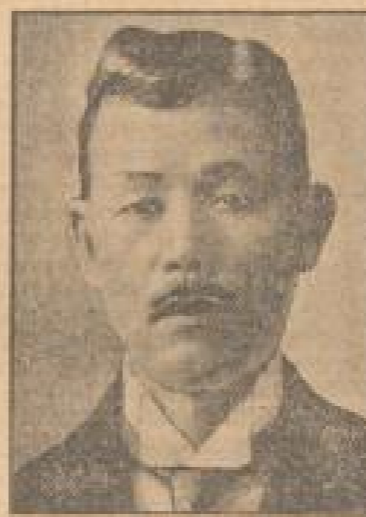
Minister Hara, der Führer der japanischen Delegation.