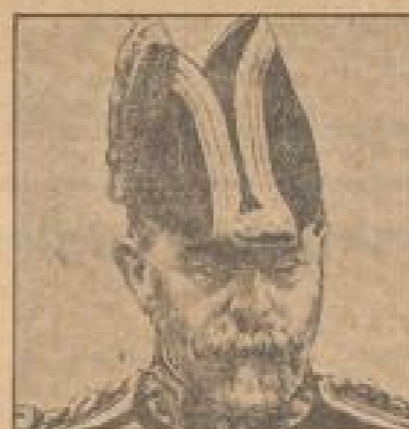
Sir Charles Bledsoe, der Oberbefehlshaber der englischen Streitkräfte.