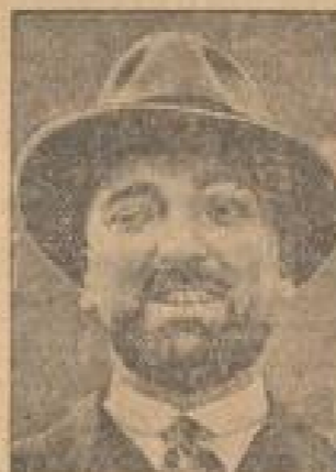
Grandi, der italienische Verhandlungsführer, der auf einseitige Anerkennung der Selbstbestimmung der Völker abzielt.

Drahtung aus Londoner Vertretung London, 21. Januar.