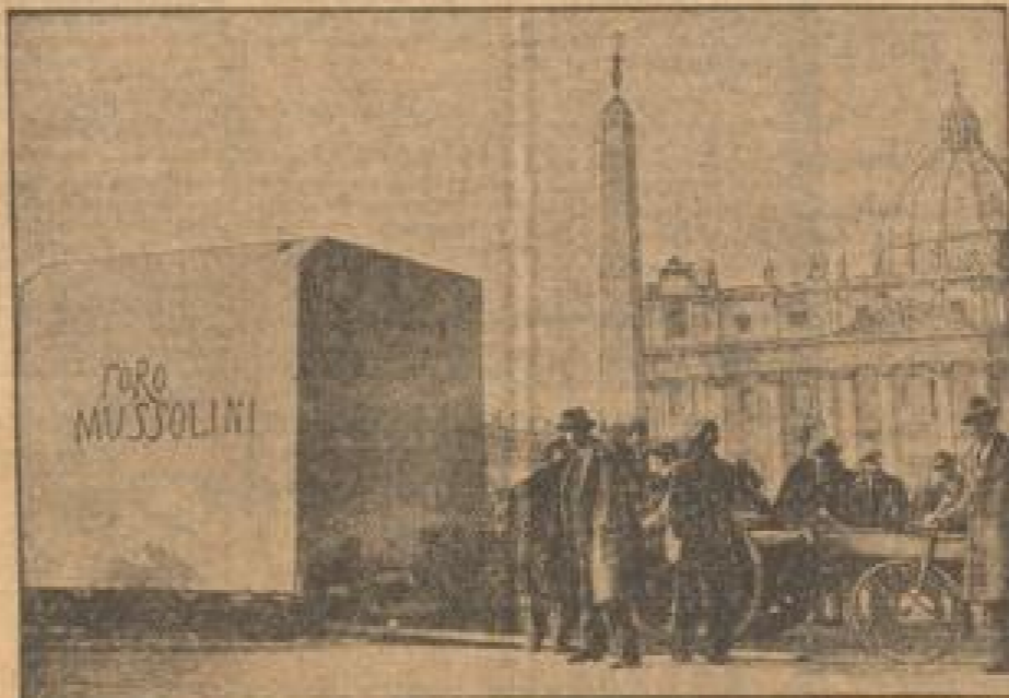
Ein ungeheurer Marmorblock für Mussolini Monument