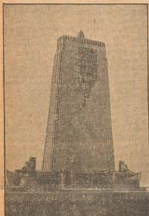
An Stern der Nieten, die um Rettung ihrer Wirtinnen aus Seenot das Leben lassen wollten...