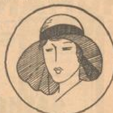
Große eleg Glocke Robthaar (inkl.) mit toller Atlasband-Garnitur 16 75