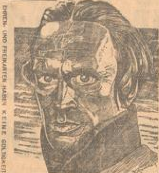
DRICH- UND FERNANDEZ HABEN KEINE SCHNITTEN

Butter Es ist bezeugt, dass in Butter keine Bakterien zu finden sind. Daher ist Butter ein sicherer Nahrungsmittel. Es ist ein Produkt des deutschen Bauern. Es ist ein Produkt des deutschen Bauern. Es ist ein Produkt des deutschen Bauern.