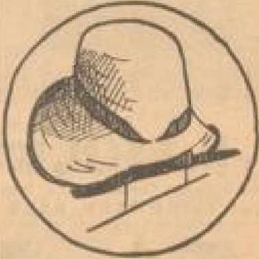
Vornehmer Perhent-Hut mit toller Band-Garnitur 18 75