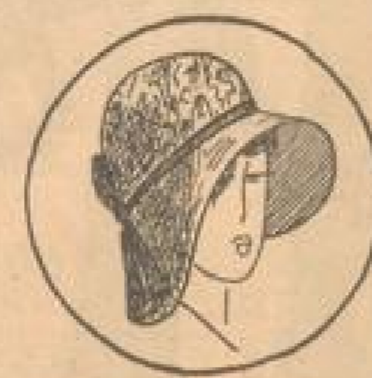
Fesche helle Glocke m. Circolrand und gekurbeltem Kopf 12 75