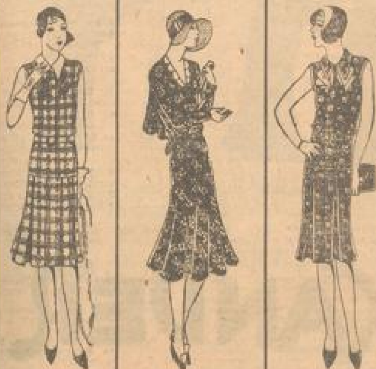
Mousseline mod. Muster kunstseidene Schleiße lech. Vollkragen 3 90