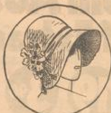
Florentiner (Barmapunta) m. Crépe Georgette, Band u. Blumentuffs 9 75