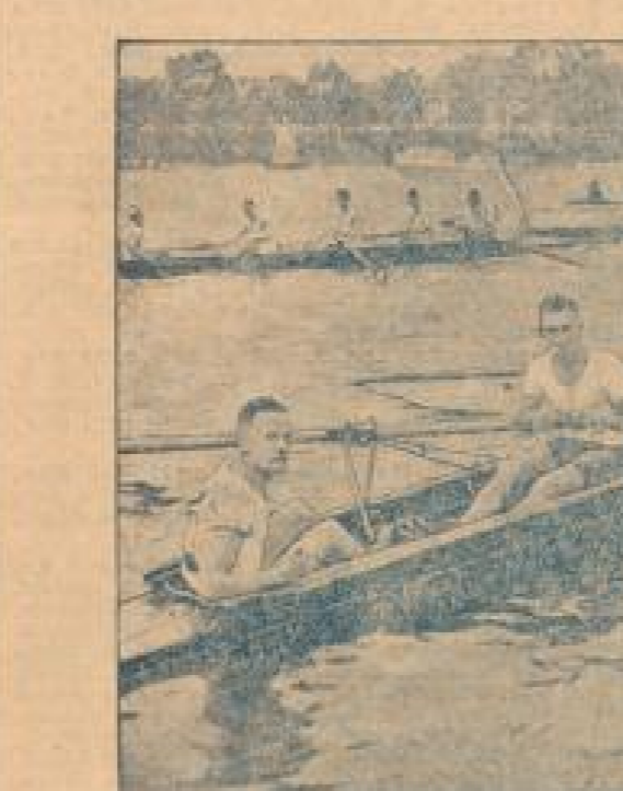
Der siegreiche Vierer des N.S. „Amicitia“

Die deutsche Staffe wird am Montag um 10 Uhr in Ziering am Wannensee starten. Die Regatta wird von tausenden Zuschauern verfolgt.