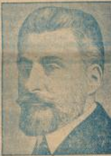
Oben: Prinz Carol, unten: Ministerpräsident Maniu, der Führer der Armee Carol ist...