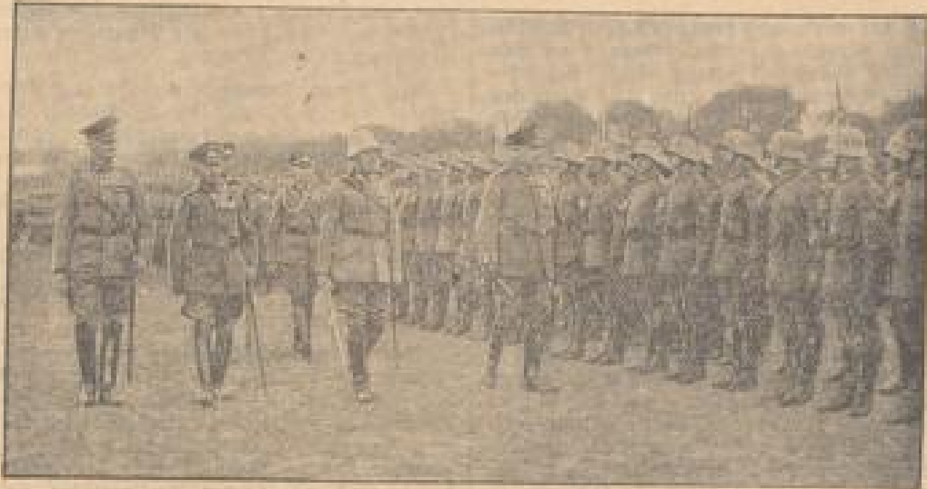
Reichswehrparade vor Sindenburg. Die Front der Berliner Wachtbataillon. Ein Vorzeichen der gesamten Truppe ist zu sehen.