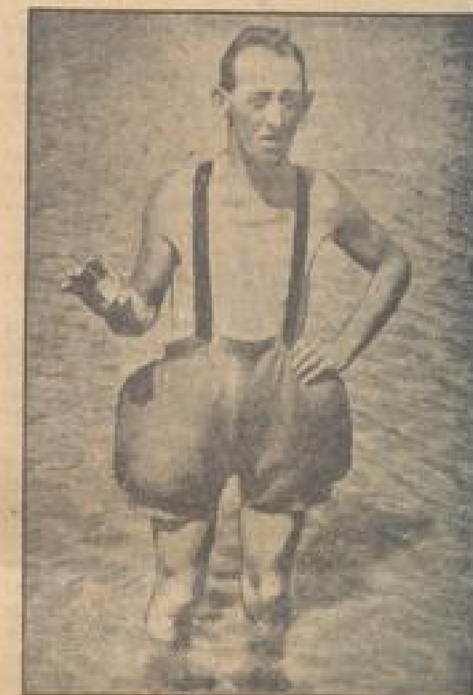
Die aufpumpbare Schwimmhilfe

Nur ein kleiner Schieber berührt und Nichtschwimmer gehen unter, sich nach Belieben über Wasser zu halten.