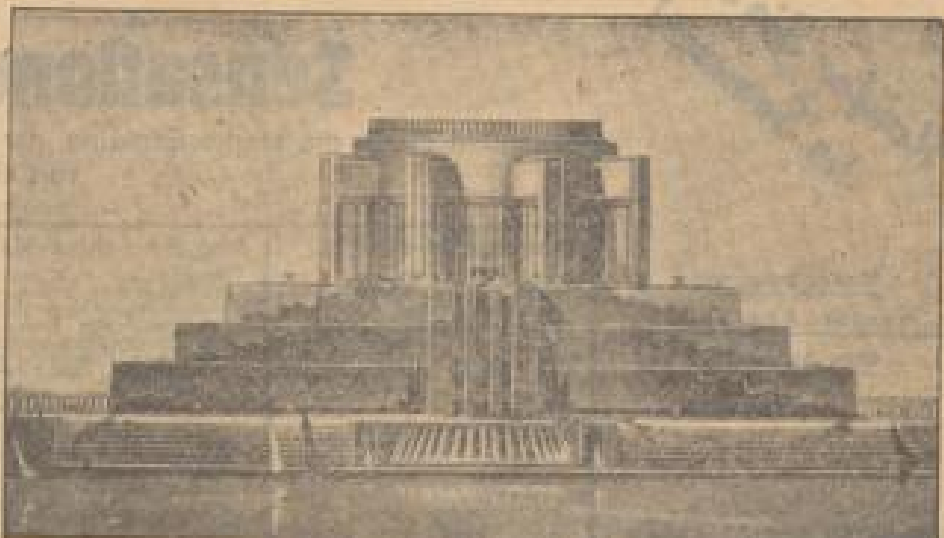
Der preisgekrönte Entwurf für das „Amerikanische Museum“