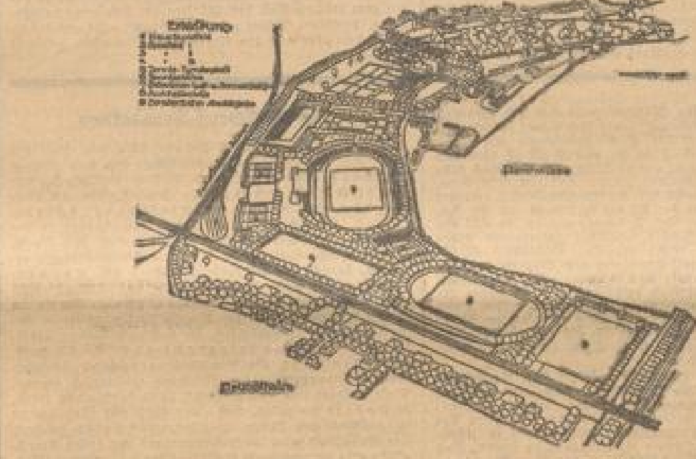
Stadion und Rennwiese: Die Stätten der Turnwettkämpfe