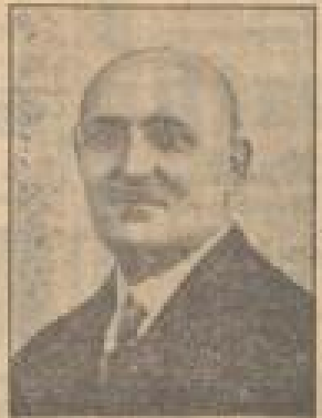
Ludwig Stall Werksmeister Körperliche Erbringung in Verbindung mit der Arbeit am inneren Menschen macht unsere Jugend zu tüchtigen Staatsbürgern.