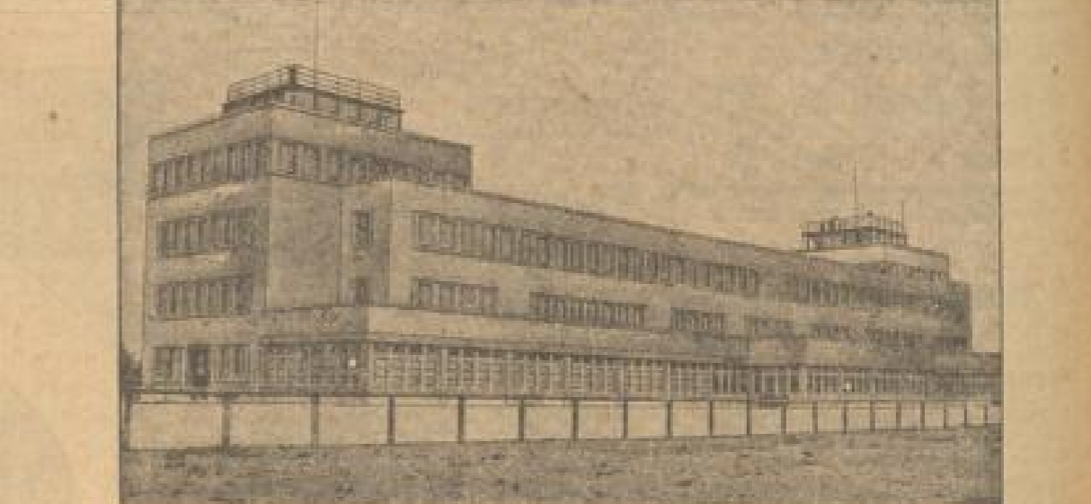
Der Flughafen München-Oberwiesenfeld wird am 1. Mai eröffnet. Mit seinen großzügigen neuen Anlagen wird er den modernen Fluglinien Deutschlands entsprechen. Eine neue Verkehrsverbindung über München werden gleich zeitig mit der Eröffnung des Flughafens eröffnet.