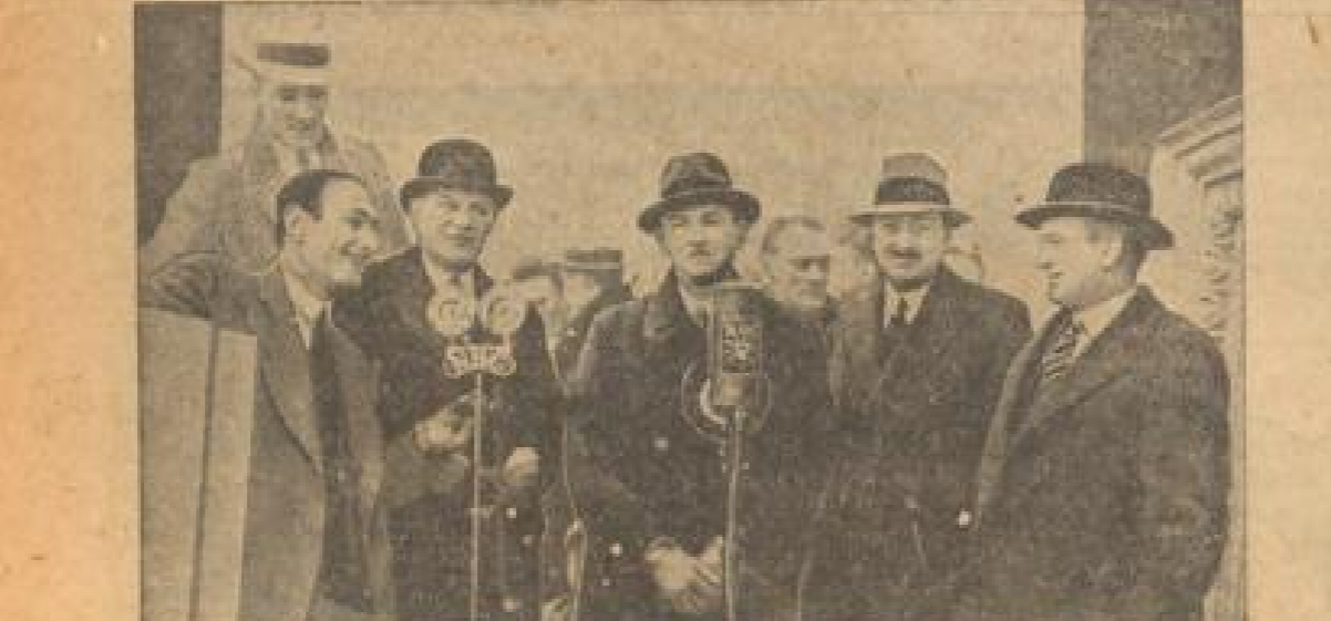
Sendung von der Spitze des Kapitols in Washington. Am Mikrophon: Der deutsche Botschafter v. Preitwitz und Goffen. Zum ersten Mal konnten deutsche Botschafter eine Sendung nach Amerika machen. Von der Spitze des Kapitols in Washington wurde eine Abfertigung in deutscher Sprache gehalten.