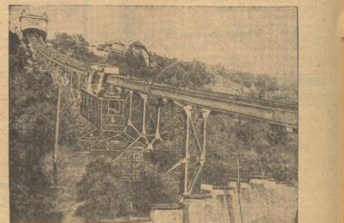
Von 30 Jahren, am 6. Mai 1901, wurde die erste Bergbahn der Welt von Dresden nach Loßwitz in Betrieb genommen.