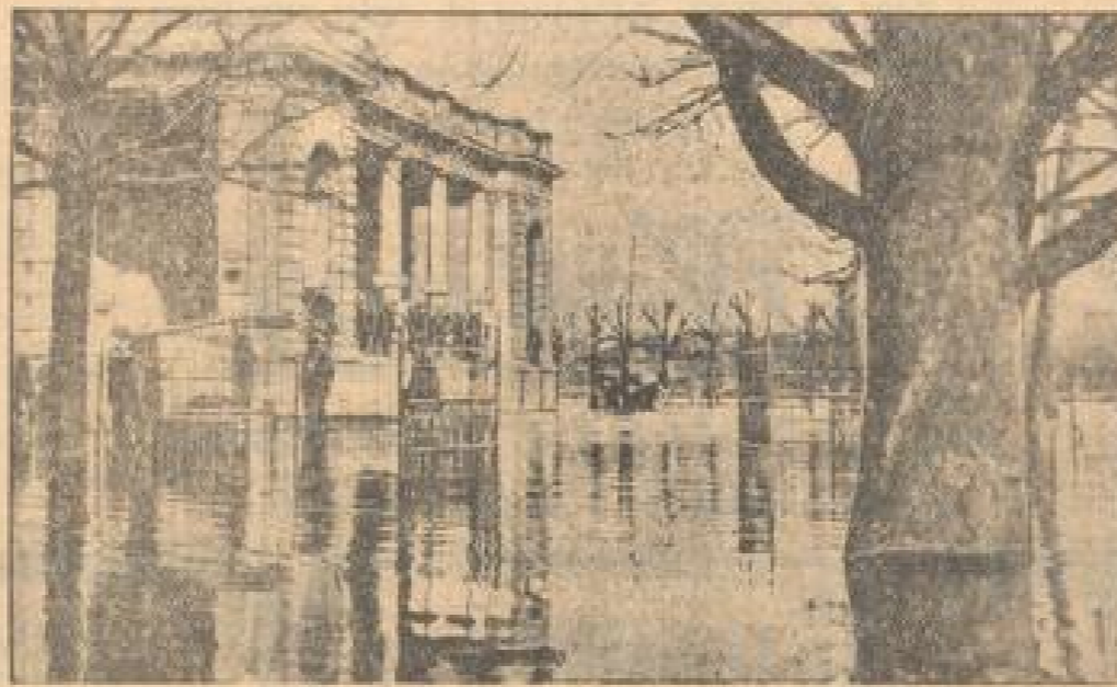
Die Straße ist in einen Fluß verwandelt

Die Ueberschwemmungen in China haben ein katastrophales Ausmaß angenommen. Straßen und Flüsse haben sich unter Wasser, an 2000 Menschen sind ertrunken.