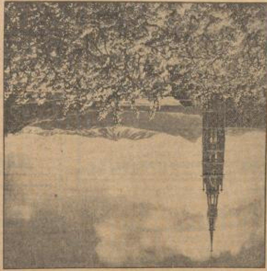
Abbildung in den Silorethen

Der Winter ist ein wunderbares Schauspiel, das die Natur in ihrer schönsten Gestalt zeigt. Die Landschaft ist in ein weisses Kleid gehüllt, und die Luft ist frisch und klar. Die Bäume sind mit Schnee bedeckt, und die Dächer der Häuser glänzen in der Sonne. Die Kinder spielen froh im Schnee, und die Vögel fliegen über den blauen Himmel. Der Winter ist eine Zeit der Ruhe und der Schönheit. Er ist eine Zeit, in der wir uns entspannen und die Natur in all ihrer Pracht bewundern können.