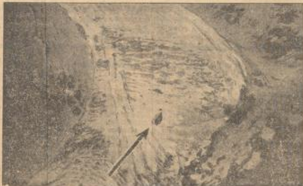
Piccard's Ballon auf dem Großen Gurgl-Gletscher Wiedergabe nach Berlin Telegraphische Meldung