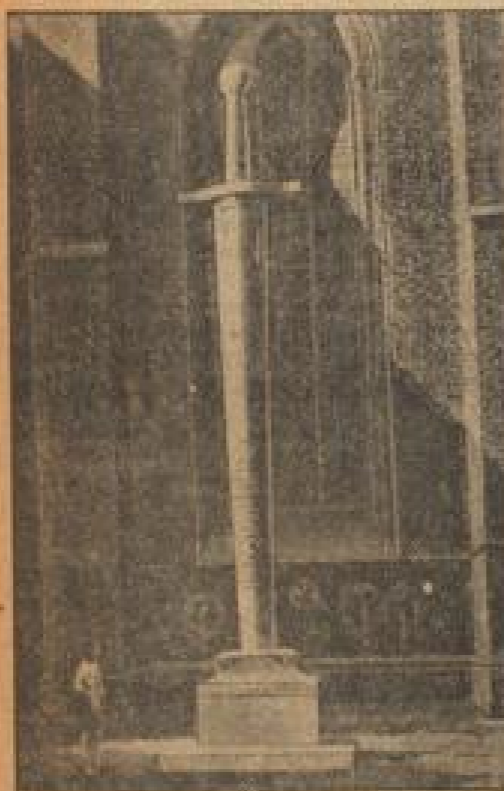
Das neue Kriegerehrenmal in Sternberg (Medienburg).