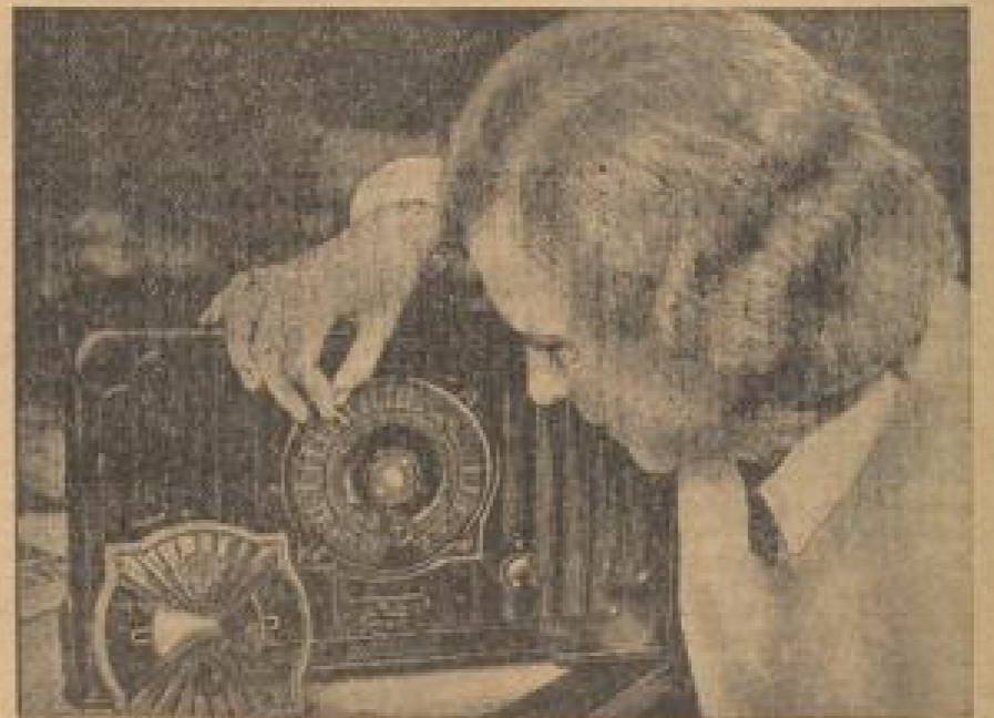
Reparierbares Wellenfeld an einem Telephon-Apparat. Die Namen der Stationen werden auf kleinen Schildchen neben den Teilröhren eingeschrieben.