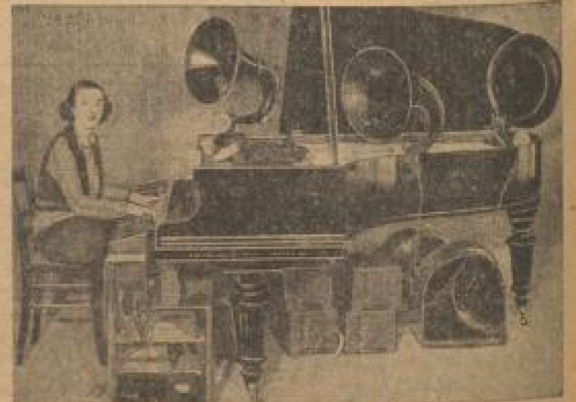
Stimmenerregende Neuheit: Grammophon im eigenen Heim

Dunkel: Die Bühnenszene des Marionettentheaters, das bei der „Vormarsch“ großen Erfolg erlangt. Schallplattenmusik begleitete das Spiel der Puppen. Rechts: Der Bühnen-Übersichtstisch, der Direktor des Marionettentheaters, liegt hinter den Kulissen im Hintergrund.