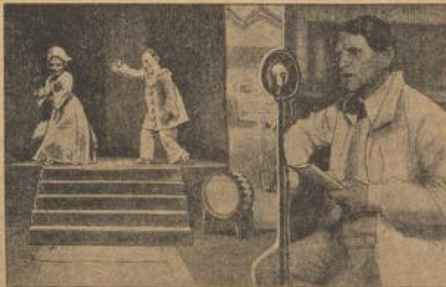
Marionettentheater mit Schallplattenmusik