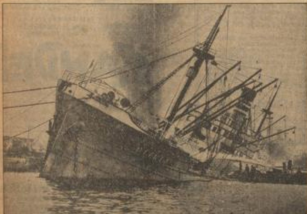
Ein Feuerlöschboot sucht den durch das eingedrungene Wasser bereits halb gesunkenen Dampfer zu löschen.

Der Dampfer „Manga“ des Verkehrs-Unternehmens geriet mit seiner Ladung auf See in Brand und wurde in den Hafen von Antwerpen gebracht, wo die Löscharbeiten im Gange sind.