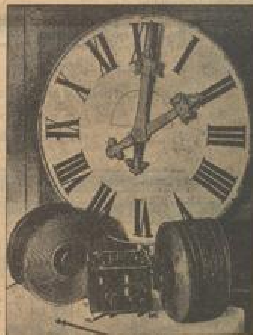
Sie geht seit 60 Jahren ununterbrochen und hält noch immer die genaue Zeit, ohne nachgezogen, ohne gestellt zu werden. Sie ist die „ewige Uhr“ des Wiener Ingenieurs Wehl, die durch Zufall in Bewegung geriet, als die alte Uhr zerbrach im Stadtpark von Wien.