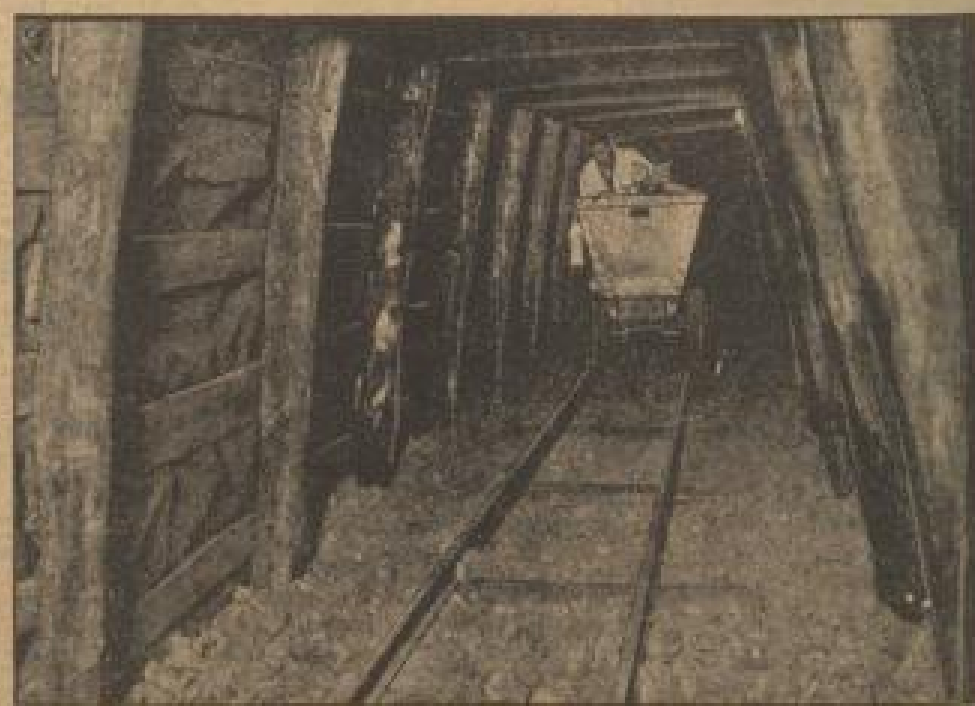
Ein Grubenhund im Schacht des künstlichen Bergwerks

In den Kellerräumen der Berliner Ludwigs-Brücke wurde unter Leitung des Oberbaumeisters Dr. F. H. v. Siedentz ein modernes künstliches Bergwerk zu Studienzwecken errichtet. Gewaltige Stützwerke sind dort aufgestellt, Verschiebungsmessungen und Schwingungsmessungen angebracht, um denen die Einwirkungen der Bergwerksarbeiten nachvollzogen werden können.