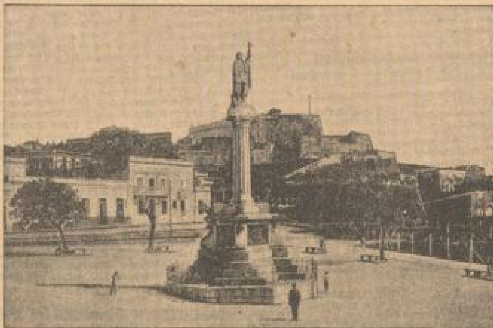
Der Hauptplatz von San Juan, auf der Insel Portorico, die besonders schwer betroffen wurde

Über Mittelamerika ist ein Tornado niedergelassen, der besonders auf der Insel Portorico und in Mittelamerika große Verwüstungen anrichtete. Man rechnet mit circa 600 Toten.