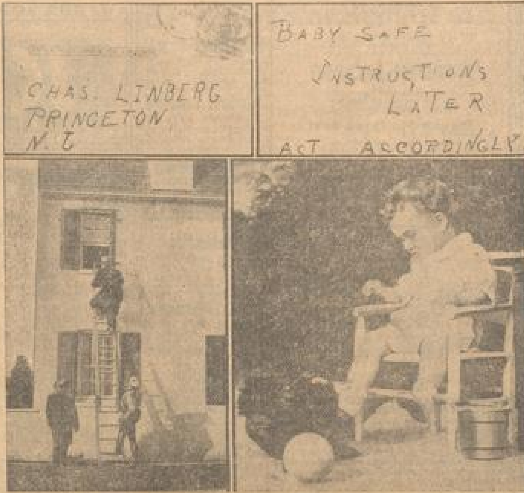
Ober: Die Vorbereitungen der Entführung, die die Entführung des Kindes an Lindberghs hielten. Der Kopf der Mörderin lautet: 'Mama in Schweden, Amerikanerinnen haben, Gendarmen, Haken links'. Die Bilder, die von den Entführern benutzt wurde, wird von Detektivs auf Flugblätter unterteilt. Aus dem oberen Bild wurde das Bild herausgelassen. Unten rechts: Das letzte Foto des kleinen Lindbergh, das 11 Tage vor der Entführung aufgenommen wurde.