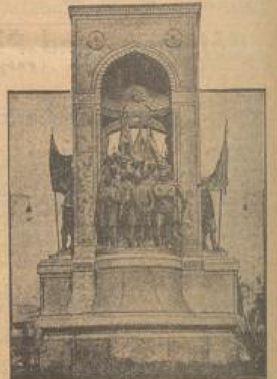
Das Bronzedenkmal für den türkischen Staatspräsidenten in Istanbul (Konstantinopel). In den reichlich geschlachten Figuren stellt die nationale Ornamentik des Unterempfindens in willkürlicher Kontrolle.