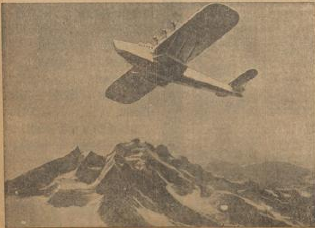
Do X auf dem Flug über die Alpen

Die neue Meeresflugmaschine der Dornierwerke, Do X, hat bei ihrem längsten Probeflug unterzogen, der von Obersee über die Alpen und zurück führte.