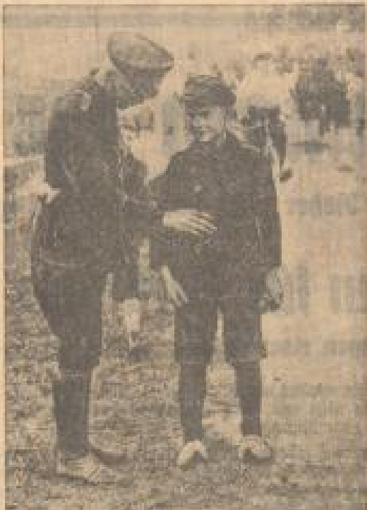
Um den Schmuggel, der an der deutsch-holländischen Grenze...