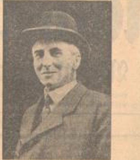
Sir John Simon, der englische Außenminister