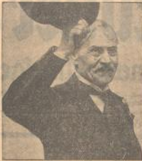
Ramsay MacDonald, englischer Ministerpräsident