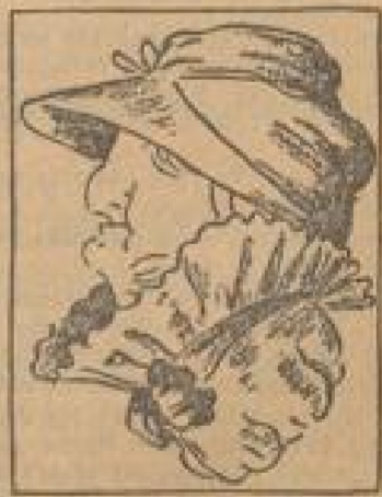
Das Frauenbildchen jenseitig, besternte

Dem Bauernmann ist froh zumut, die Ernte, so wird ihn einbar gut.