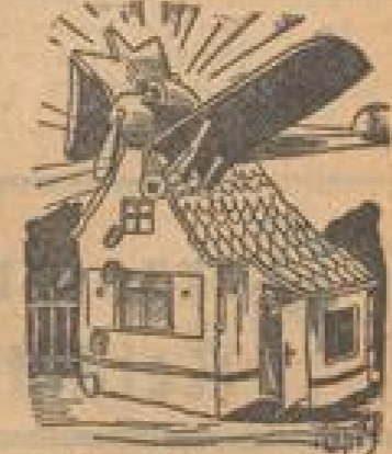
„Wir war doch eben so, als wenn jemand kopfte“