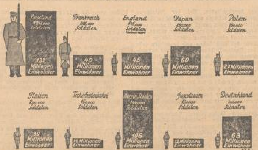
Unter Schuß zeigt das Verhältnis von Bevölkerungszahl und Heeresstärke der einzelnen Nationen. Die Heere sind zum Verhältnis der Bevölkerung...