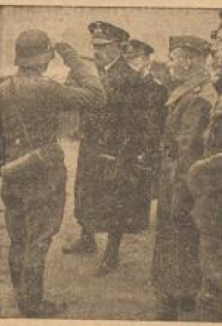
Generaladmiral Carl an der Kanalflotte