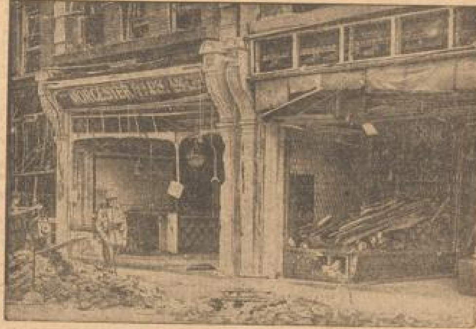
Militärschutz gegen Plünderer

In einem späteren Aufruf an das rumänische Volk konnte General Antonescu feststellen, dass die Autorität des Staates überholt gewesen wäre. Der Staatsführer schloß daran den Aufruf zur Einheit aller Rumänen um die Staatsoberhäupter, die Armee, den Landes- und den König. In einem Tagesbefehl an die Armee sprach General Antonescu seinen Dank aus für die Haltung der rumänischen Truppe und wies die Ordnung im ganzen Lande durch Weisung wiederherstellen zu lassen. Durch ein Dekret wurde die Abfertigung aller Waffen angeordnet, die sich in der Hand von Zivilpersonen befinden. Gleichzeitig wurden alle öffentlichen Zusammenkünfte verboten. Eine Verlautbarung des Generalstabschefs der Armee bezeichnet die Nachrichten einer gewissen Auslandskorrespondenz als Rumoren, wonach Angehörige der rumänischen Armee ihre Pflichten nicht erfüllt hätten. Inzwischen geht das Leben in Bukarest wieder seinen normalen Gang.