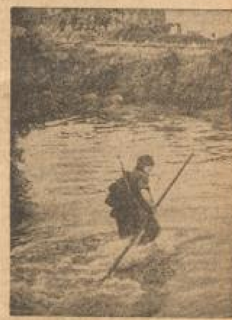
„Der Sieg im Westen“

Generaladmiral Carl beherrschte in diesen Tagen die Befehlsgewalt an der Kanalflotte. Hier wirkte ein deutscher Führer die deutsche Flottille zum Sieg gegen den Gegner.