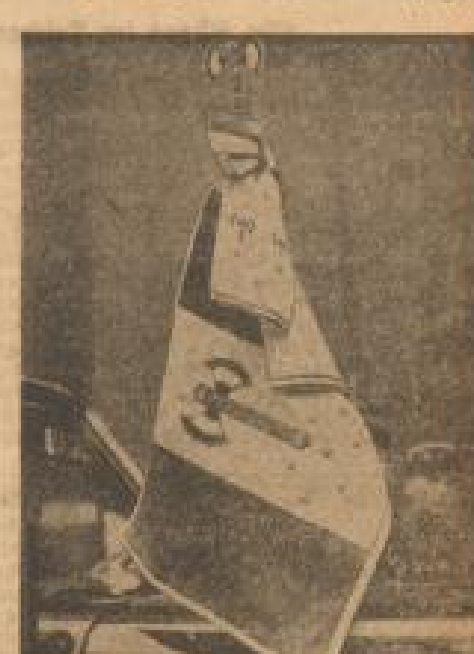
Neue Flagge des Marschalls Petain