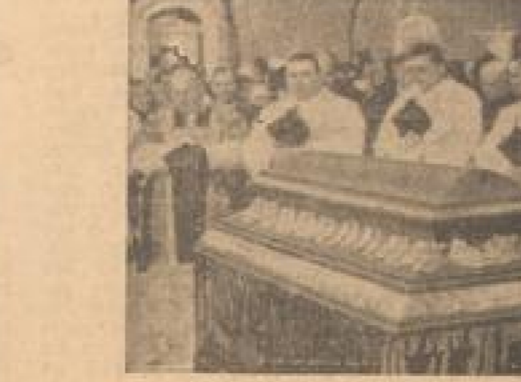
Bildtelegramm von der Befehlsführung Graf Ullrich

Das ist ein Bild der Luft, die sich über dem Meer zu sehen ist. Die Luft ist ein Bild der Luft, die sich über dem Meer zu sehen ist. Die Luft ist ein Bild der Luft, die sich über dem Meer zu sehen ist.