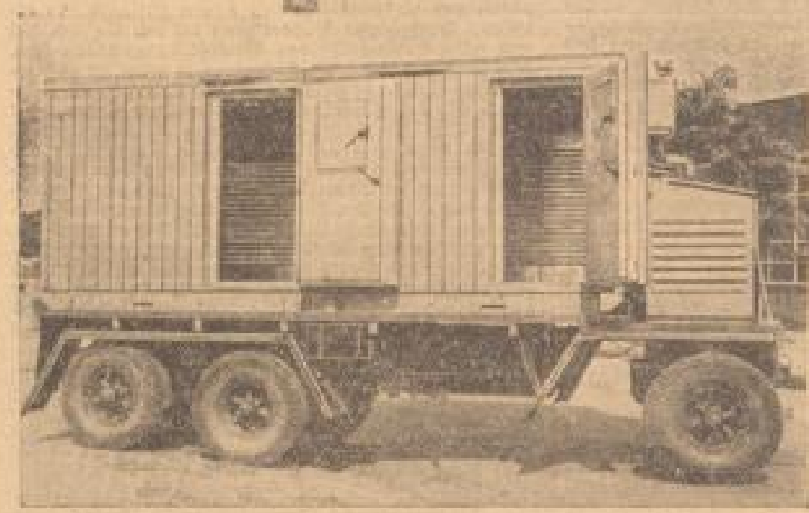
Links: Der kleinere Einfrister mit einem kleineren Raumvolumen (einrichtungen) ist für den Einsatz in die verschiedenen Anbauformen und vor allem dort, wo hochwertige Gemüse- und Fleischfrüchte in möglichst haltbaren Packungen.