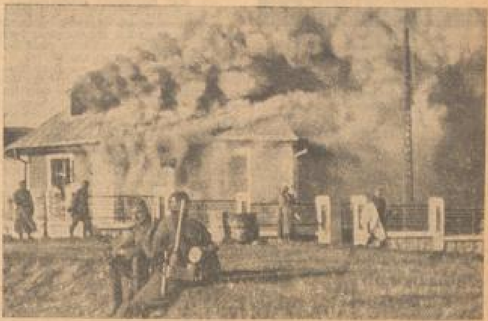
Ehe sie flohen, steckten die serbischen Jäger ihr Grenzhaus in Brand (V.R. Oker, Westhoffmann, Sonder-Multiplix-B.)