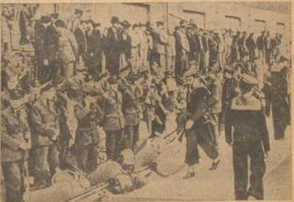
Griechenland — Englands Aufmarschbesatzung Diese Kolonne zeigt die Bewegung deutscher Truppenbesatzung auf griechischem Boden. Sie wurde im Dezember 1940 gemacht, als lange vor der Zeit, als Deutschland zum Krieg (1941) übernahm, als Gegenmaßnahmen Griechen machte. (Westhoffmann, Sonder-Multiplix-B.)