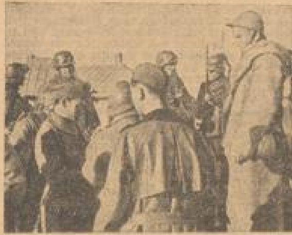
Die ersten serbischen Gefangenen werden verhört (V.R. Oker, Westhoffmann, Sonder-Multiplix-B.)