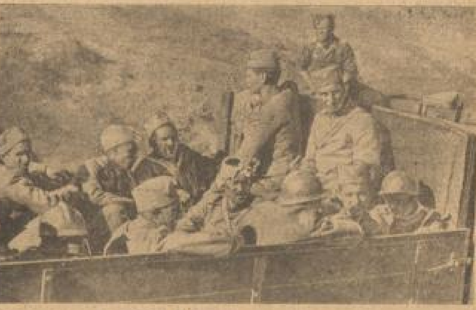
Serbische Gefangene wurden eingebracht. Schon in den ersten Tagen des deutschen Vormarsches wurden zahlreiche Gefangene gemacht. Diese hier sind Gefangene aus dem Tage zum Durchbruch. (H. G. B. S., Sonder-Beilage-FK)

Stabskapitän in ein Kampfflieger verlegt und am 1. März 1929 zum Hauptmann befördert. Seit 15. Januar 1931 ist er Kommandeur einer Kampffliegergruppe.