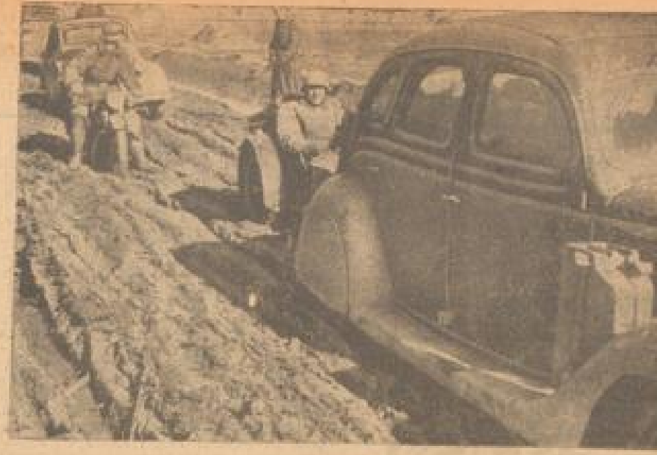
In endloser Folge sieht die Kolumnen der motorisierten Einheiten über die verschlammten Straßen im Südosten.