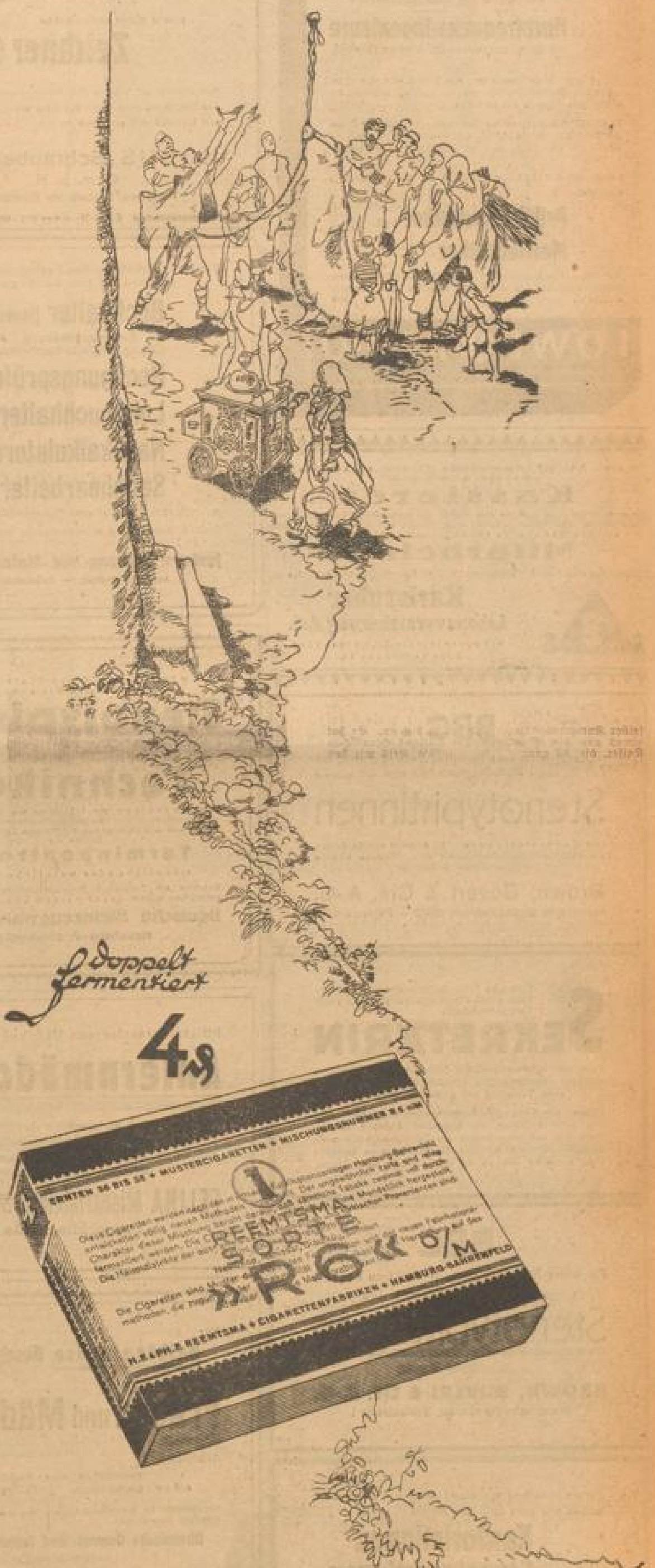
Skizzen aus den Ursprungsländern der RBE-Tabake

TREUHELFF... Geschäftsbüro München 31, Postfach 37