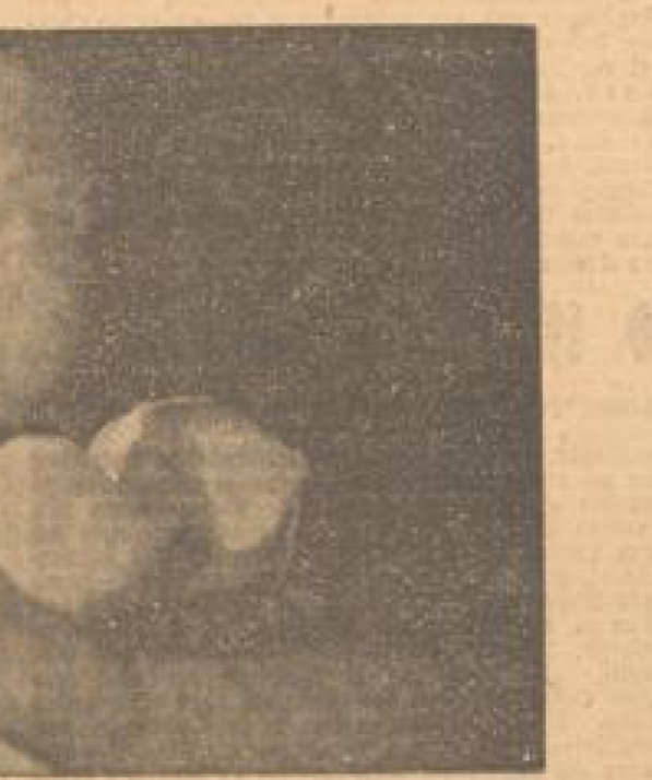
Eben aus dem Ei geschlüpft! Noch völlig unbekannt mit den Gefahren dieser Welt...