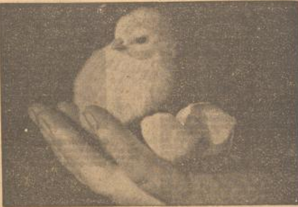
Eben aus dem Ei geschlüpft! Noch völlig unbekannt mit den Gefahren dieser Welt...