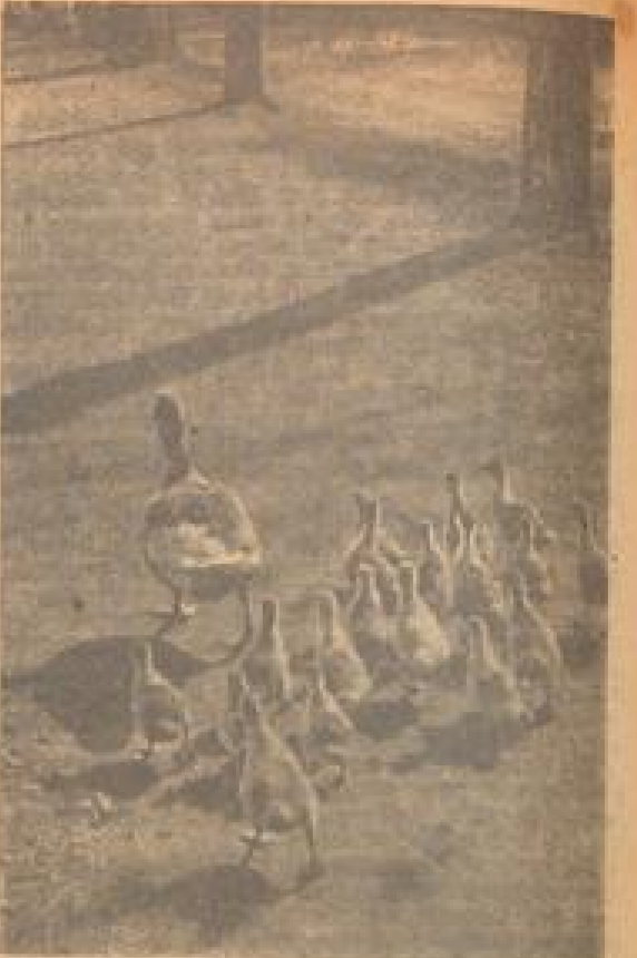
Auf der großen... Auf der großen...