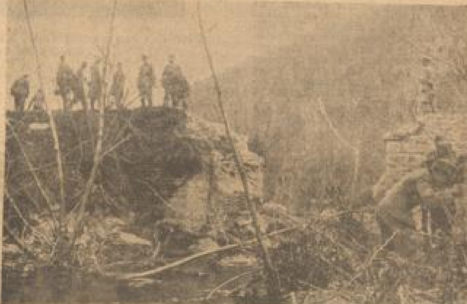
Von den Griechen gepresste Grenzbrücke. Das bedeutet aber für den Vormarsch unserer Truppen kein Hindernis, denn schnell werden deutsche Panzer eine neue feste Brücke gebaut haben. (H. G. B. S., Sonder-Beilage-FK)

Befehlshaber der Truppen, die in Südserbien im letzten Kriegsstage durch ihre heldenmütigen Aktionen einen wichtigen Beitrag zum Durchbruch des letzten Kriegsraums geleistet haben. (H. G. B. S., Sonder-Beilage-FK)