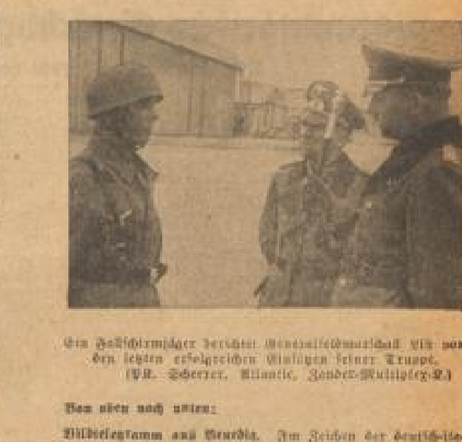
Der Oberstleutnant ...