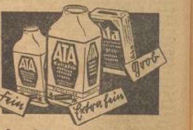
Gefertigt in den Perfil-Werken