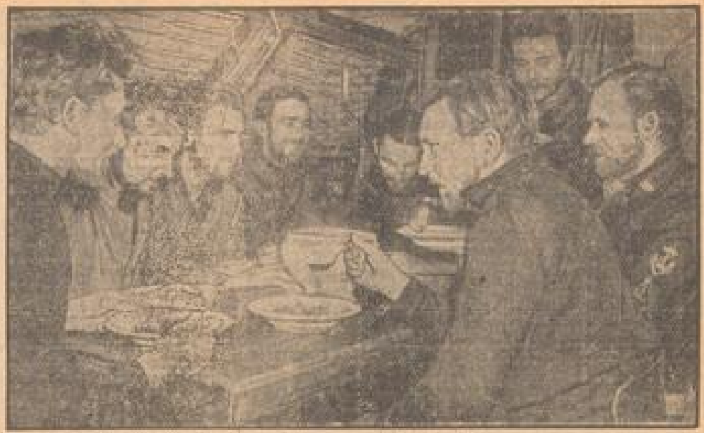
Mittagsessen an Bord eines U-Bootes

Das besonders auffällige Schwelgen der britischen Admiralität trotz des offiziellen amerikanischen Erlausens um Mittelungen, englischer Informationen über den „Athenia“-Fall wurde vom New Yorker Sprecher unterdrückt.