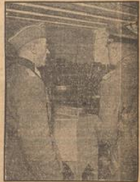
Der Oberbefehlshaber des Heeres besichtigt Panzer an der Westfront