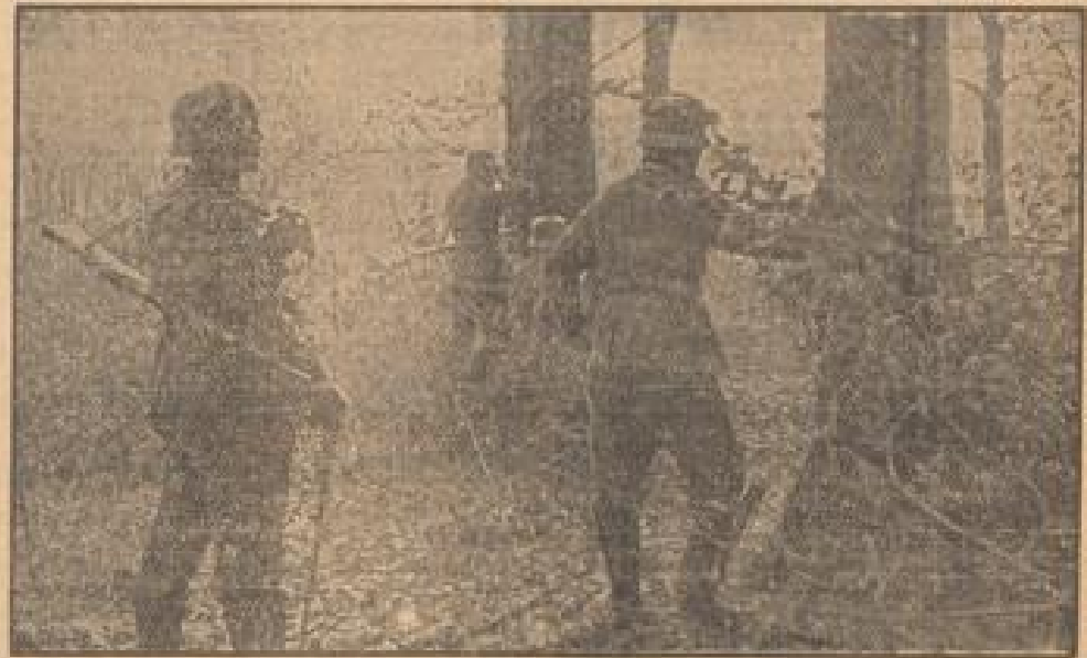
Ein Spähtrupp tastet sich vorsichtig an den Feind heran