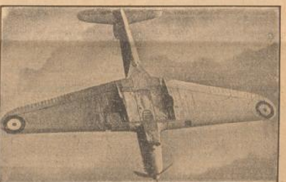
Englisches Kampfflugzeug vom Typ Fairey „Battle“. (Hr. Koop, Graf-Gottmann, Jander-Muller-Dr.)