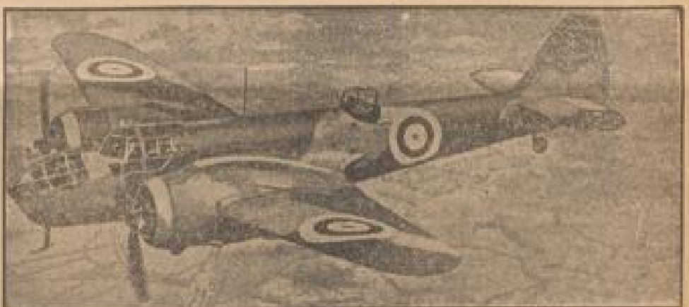
Ein englisches Kampfflugzeug „Bristol Henheim I“