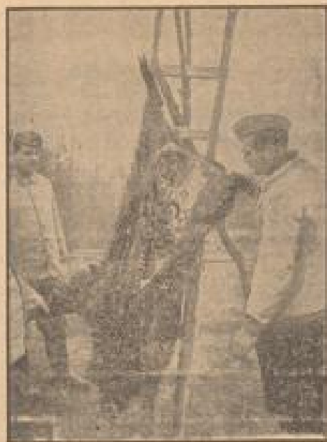
Ein netter Happen