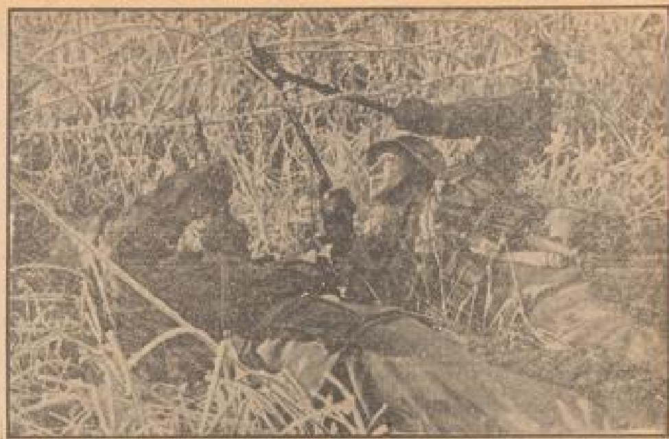
Winter im Hauptkampfgebiet. Ein Offizier mit der Truppe am Trümmerturm. (Mantel, Sonder-Multicolor-A.)