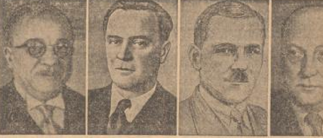
Der serbische Außenminister Mijatovic, der jugoslawische Außenminister Cincar-Markovic, der kroatische Außenminister Cerovic, der rumänische Außenminister Doga.

In Belgrad tagt die Konferenz der Balkanstaaten. Die zur Diskussion stehenden Probleme betreffen in hohem Maße die deutsche Ereignisse und besondere Interesse aller europäischen Staaten.