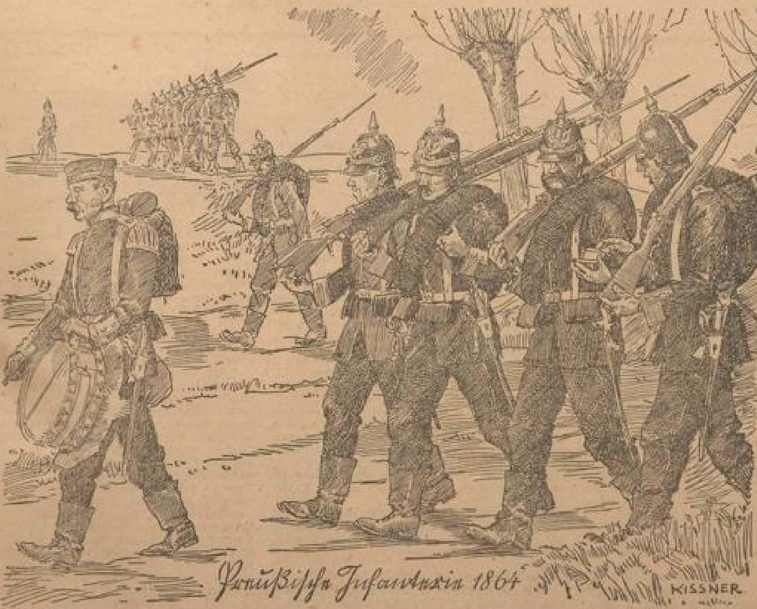
Preussische Infanterie 1864

Das Parlamentariermitglied Baldwin Webb ist als notorischer Deutschhater bekannt und bei dem Emigranten Elden handelt es sich um ein besonders solches Exemplar dieser britischen politischen Welt. Was ein polnischer „Politikwissenschaftler“ in USA will, liegt ebenfalls auf der Hand. Es handelt sich also — immer vorausgesetzt, daß die Sache überhaupt kommt — um eine ausgedehnte britische Propaganda-Expedition, um einen Transport unbeherrschter Decker, die in Amerika gegen Deutschland Stimmung machen sollen. Vielern Transport hat man offenbar ein paar Plakatenträger eingeschlossen, um auf jeden Fall einen Propagandaeffekt haben zu können — entweder mit den lebenden Deckern oder mit den toten Kindern.