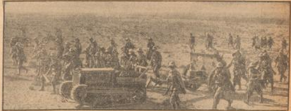
Parade in der Wüste

Doch selbst, wenn tatsächlich ein britischer Dampfer